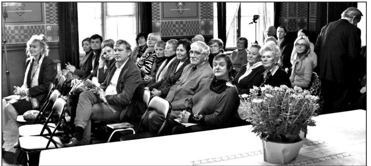
Šventinio vakaro akimirkos