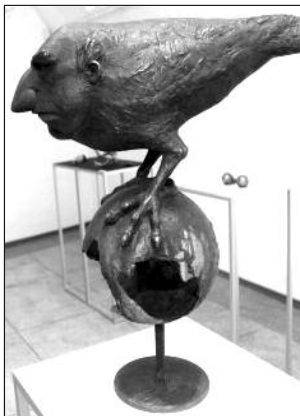
Vienas iš tarptautinės parodos „Skulptoriai skaito Donelaitį“ darbų.

1743 metų rudenį K. Donelaitis išsventintas kunigu (šiomet nuo šios datos suejo 270 metai) į Tolminkiemį atvyko tų pačių metų lapkričio pabaigoje. Tai svarbi sukaktis – sena baltiška vietovė, gražaus dvikamienio asmenvardžio (Tolmino kiemas; Tolminas ar Tolminas, tolio, tolimo ir mintijimo, minties kad ir asociatyviniai saitai, gal ir išminties kaip toliaregystės), yra susieta su kūrybingu asmeniu, statančiu, sodinančiu, rašančiu. Tai lietuviška, netgi archetipiška: įsikurti vietoje, ja rūpintis, puoselėti. Po 30 kunigystės metų Tolminkiemyje Done-