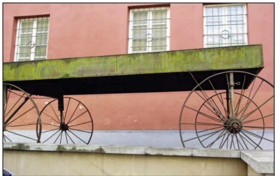
Gedimino Akstino „Vežimas“ (1998) įsikūrė Bernardinų g. 3 kiemelyje.