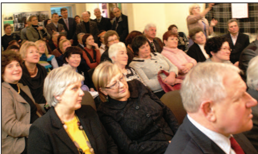
Jubiliejinio vakaro akimirkos