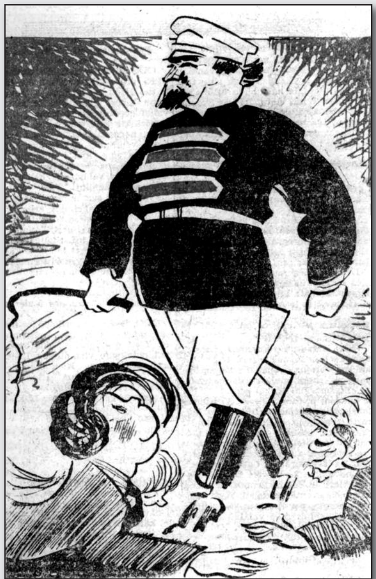
Suklupę Petras Cvirka, Salomėja Nėris ir Liudas Gira.

Perspausdintas iš 1940 Kaune einančio „XX amžiaus“ žurnalo.