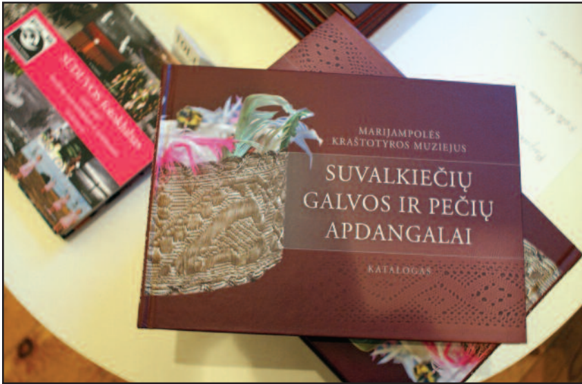
Naujausias muziejaus leidinys apie galvos ir pečių apdangalus