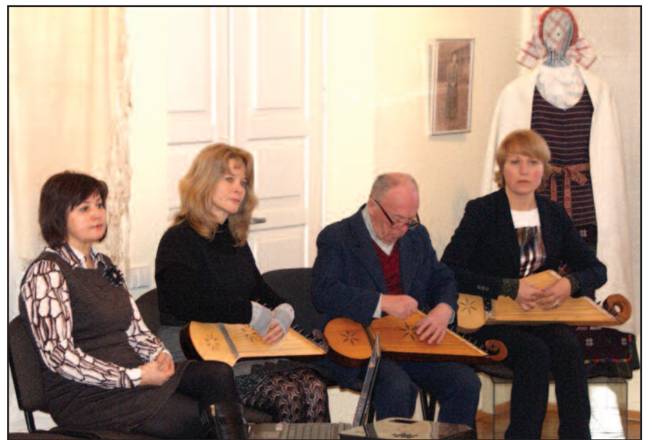
Muziejaus kanklininkų ansamblis

Jubiliejaus minėjimo renginyje buvo padėkota čia plūšantiems darbuotojams, prisiminti ankstesni vadovai, pasidžiaugta, kad prie muziejaus veikia kanklininkų ansamblis, kuris atlieka Sūduvos krašto ir mažosios Lietuvos tautosaką: dainas, kanklių muziką, sakmes, ratelius. Čia veikia ir vaikų kanklių mokyklėlė. □