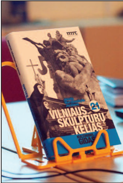
Knygos viršelį sukūrė Julius Balčikonis