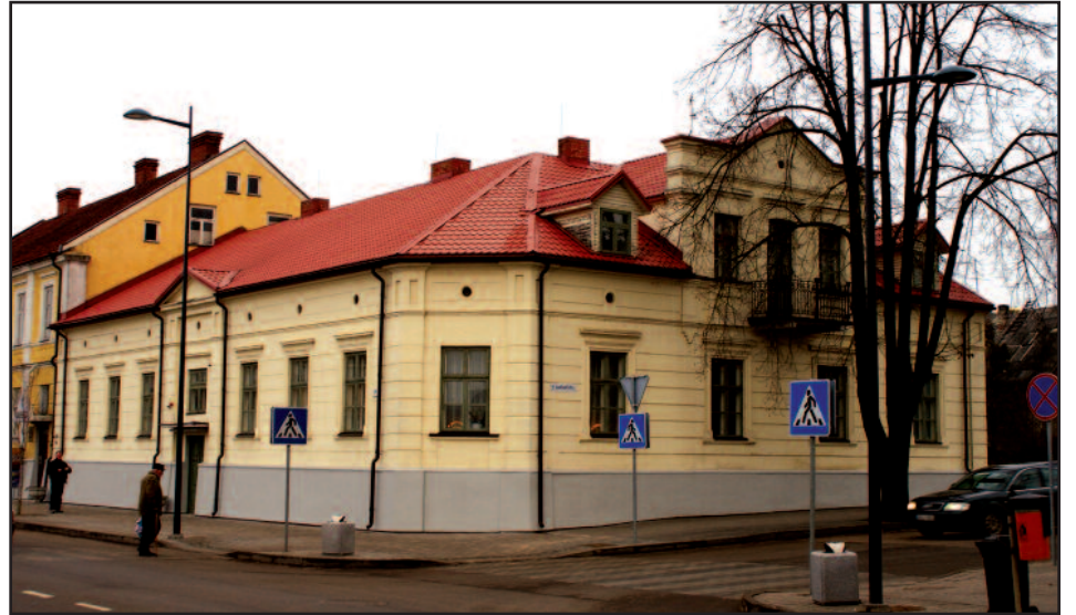
Šiame pastate muziejus veikia beveik 50 metų.