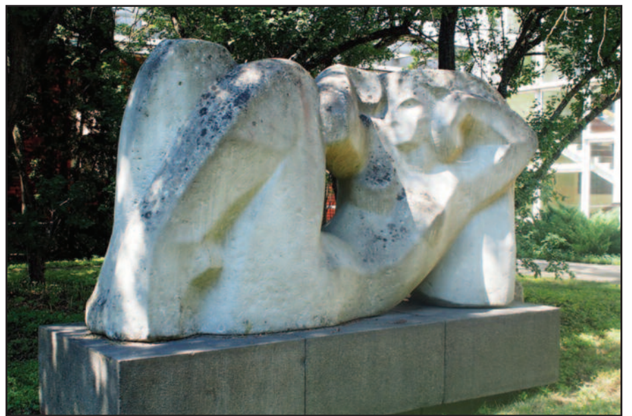
Tai viena iš rečiau sutinkamų Vilniaus skulptūrų, kurią pamatyti galima Antakalnio poliklinikos kieme (Antakalnio g. 124). Moters aktą sukūrė Vladas Vildžiūnas.