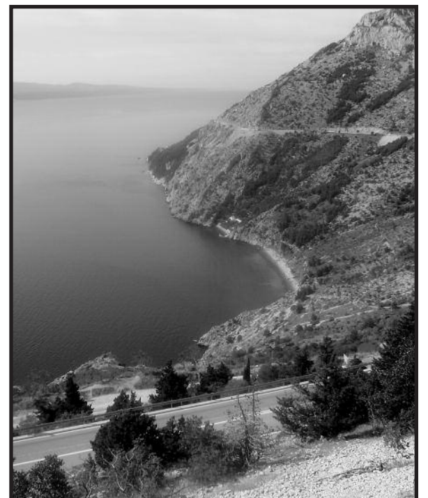
Adrijos jūros grožis

Mano tylą Tavo lūpose. Kilti ir eiti, kilti ir eiti, o Motina, Meile, Mergaite.