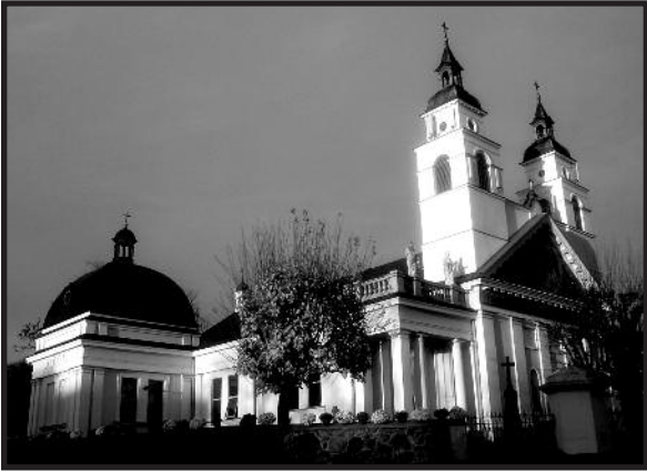
Sokulkos bažnyčia Lenkijoje, kur 2008 m. įvyko eucharistinis stebuklas