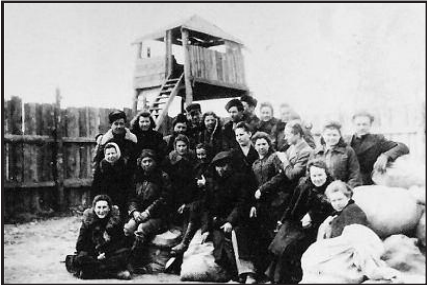
Aptverta tremtinių stovykla Sibire su sargybinių bokšteliais