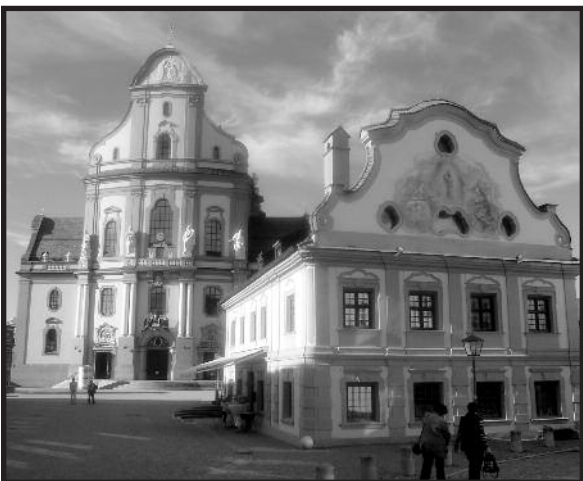
Altioingo miesto vaizdas