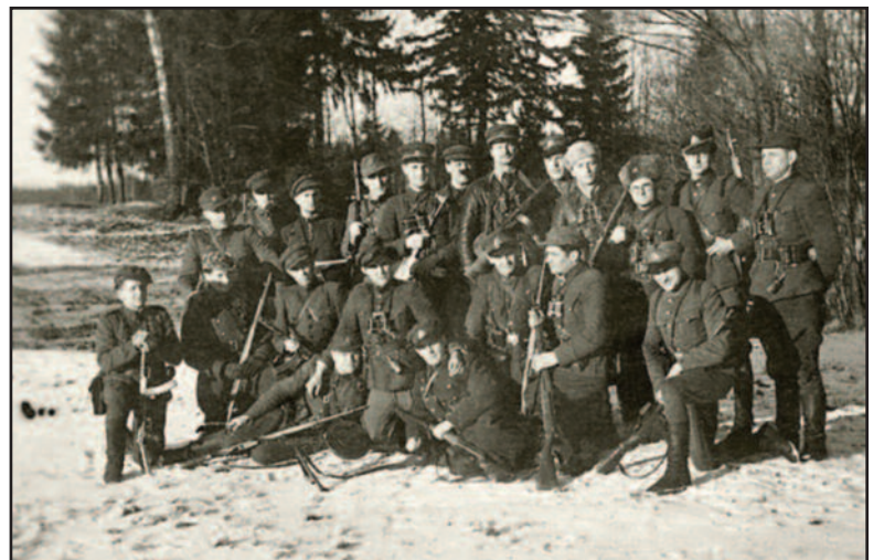
Kadras iš filmo „Trispalvis“. Partizanų vadai prieš suvažiavimą

Paskutinieji liudytojai... Todėl ypač brangintini. Vardas, pavardė ir slapyvardis. Antanėlis, Bėda, Tigras, Ažuolas, Siaubas, Šarka, Chrizantema, Tulpė... savo dabartinių namų jaukiuose kampe-liuose: krėsluose, ant sofos, lovoje arba šalia koklinės prieždos, kur