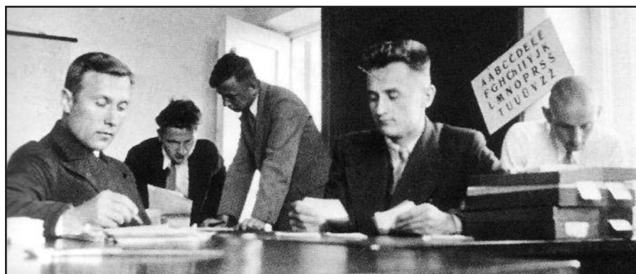
„Lietuvių kalbos žodyno“ redakcija, apie 1934

O iš rankų tiesiog pasislėpęs buidelis kerta.