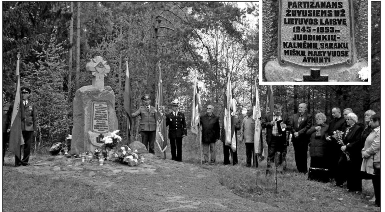
Paminklo, skirto Telšių būrio partizanams, atidengimo iškilmės

Todėl negalima nesidžiaugti, kad nelaukdami valdžios malonių, šios iniciatyvos imasi nukentėjusieji, aukų artimieji, pakutinieji kovų už laisvę liudytojai. Nedaug mūsų piliečių apie tai sužino; kad ir apie gegužės 10 d. Nevarėnų seniūnijoje netoli Telšių atidengtą paminklą, sukurtą skulptoriaus Os-