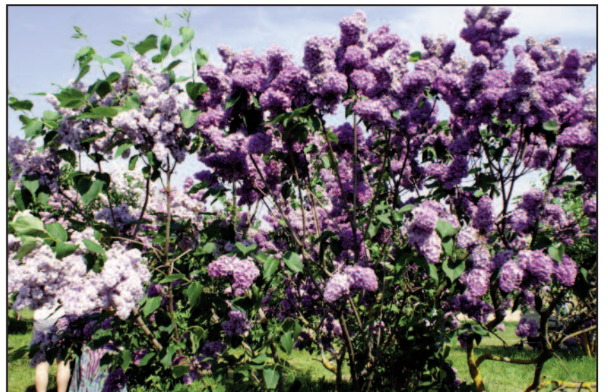
Duobelės alyvų sodas.

Vietiniai gyventojai tvirtina, kad Puokainiuose visada būna geras oras. Net jei visai netoli lyja ar sninga, virš keistojo miško danguje šviečia saulė. Daugelis čia jaučia savitas energijos sroves, kiti regi vizijas arba priima informacijos srautus. Padavimai apie čia įvykusius stebuklingus išgijimus skatina daugelį vykti į Puokainius su viltimi susigrąžinti sveikatą ir sielos pusiausvyrą. □