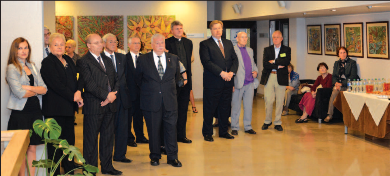
Akimirka iš parodos pristatymo