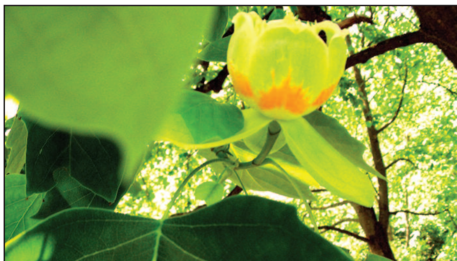
Kauno botanikos sodo bijūnai.