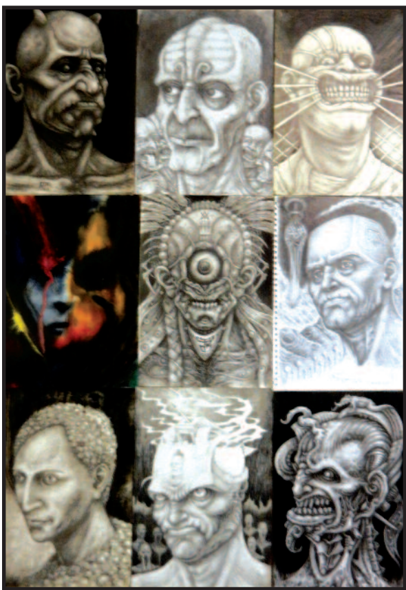
Debronzes. Portretai: galvos studija, 2007–2014