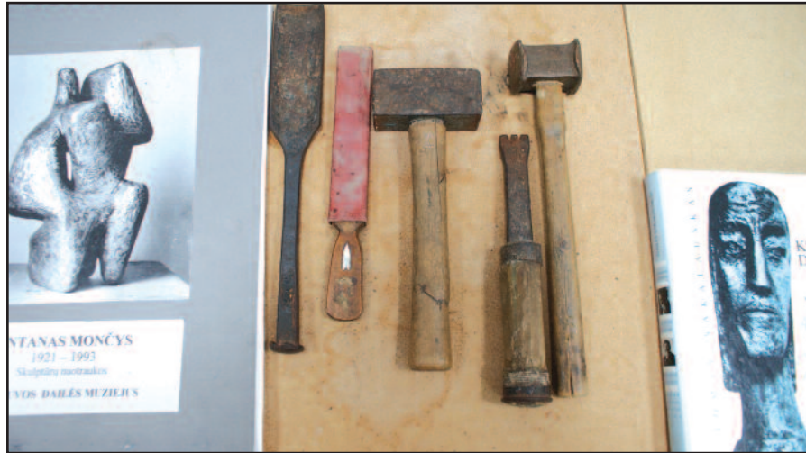
A. Mončo darbo įrankiai

„Mano močiutė, visada klausiusi ‘Amerikos balso’ radijo laidų, vieną kartą išgirdo pranešimą, kad skulp-