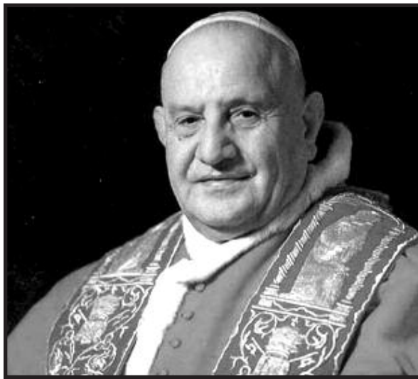
Popiežius Jonas XXIII

Sakoma, kad Jonas XXIII buvo pirmas ir, ko gero, vienintelis popiežius, kuris mėgo rūkyti cigaretes, o ir į vyno taurę ranka nenumodavo. Kiti