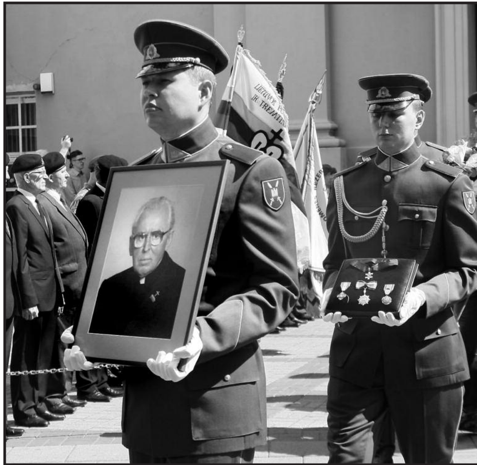
Iškilminga laidotuvių procesija.