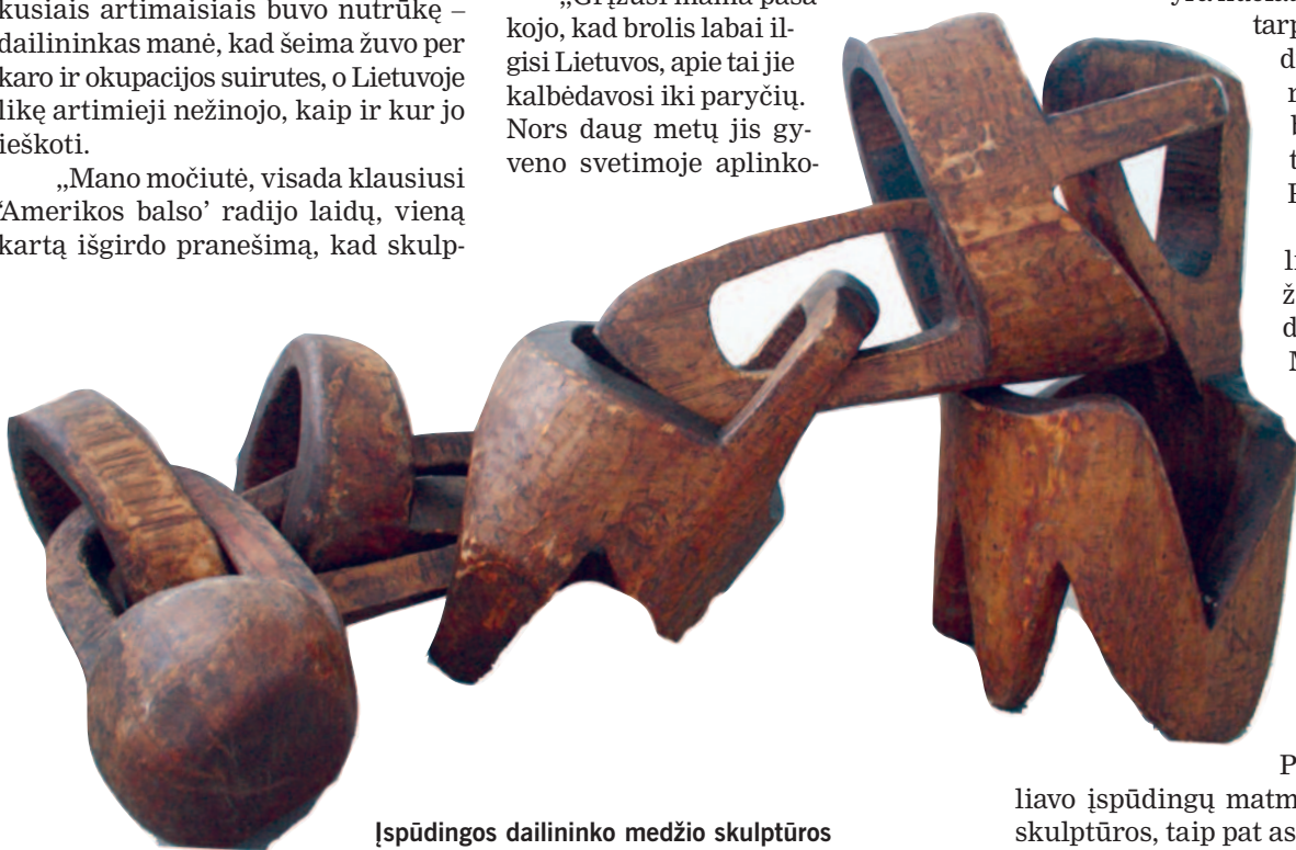
Išpūdingos dailininko medžio skulptūros

„Kada nors visi sugrįšime čia“, – taip artimiesiems sakęs į tėviškę 1989-aisiais metais atvažiavęs dailininkas. Jis pats galvojo apie sugrįžimą gyventi į Lietuvą, bet nespėjo. Į tėviškę sugrįžo dailininko darbai, jis pats mirė Paryžiuje ir amžinojo poilsio atguldė šalia tėvų Grūšlaukės kapinaitėse. Sugrįžo amžiams į šalį, apie kurią dienomis galvodavo, o naktimis sapnuodavo. □