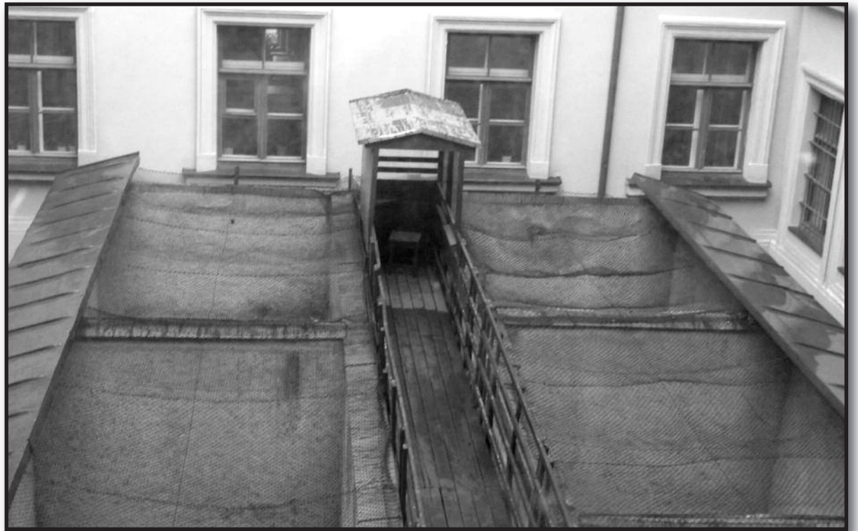
Vaizdas pro langą iš kalėjimo vienutės