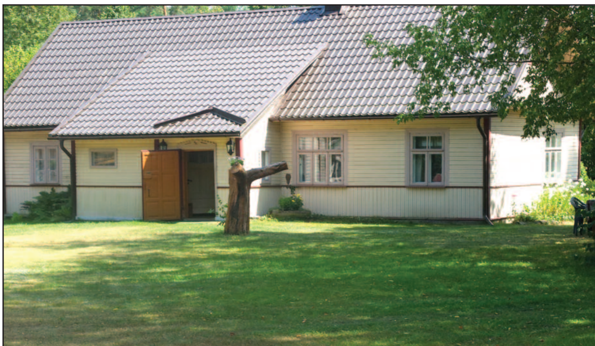
Grigų sodybos fragmentas.

Manydamas, kad kiekvienas mokslininkas per dešimtmečius sukauptų mokslo žinių neturi teisės