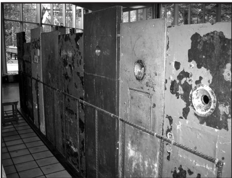
KGB kalėjimo durys iš Okupacijos muziejaus Taline, Estija