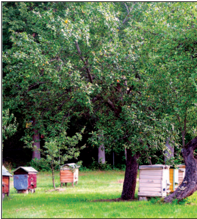
Grigų sodyba su bičių aviliais