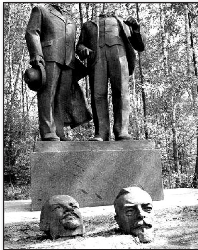
Ekspozitai iš Grūto parko. V. Leninas ir V. Mickevičius-Kapsukas – kuriam kuri galva priklauso?