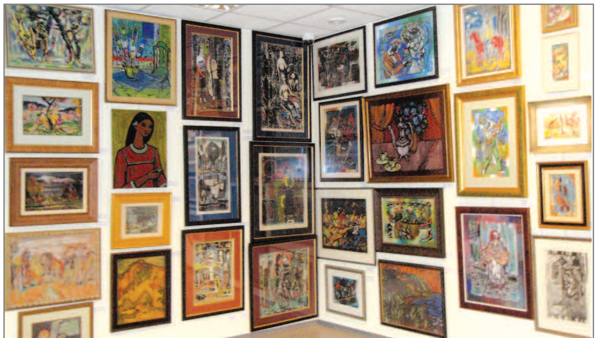
Pylimo galerija iš vidaus

Dar buvo trumpas susitelkimas Freiburge, bet