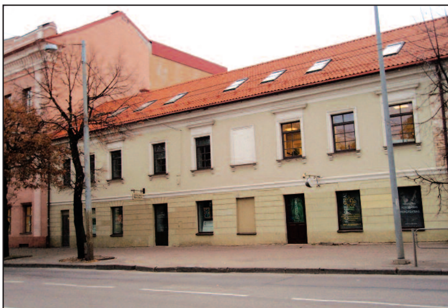
Pylimo galerija iš lauko pusės