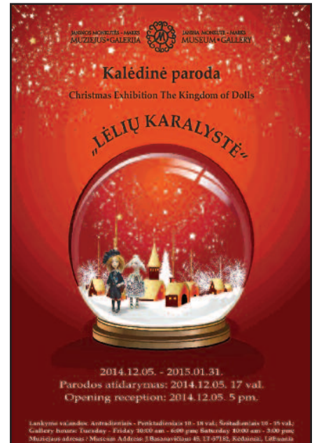
Lėlių parodos plakatas