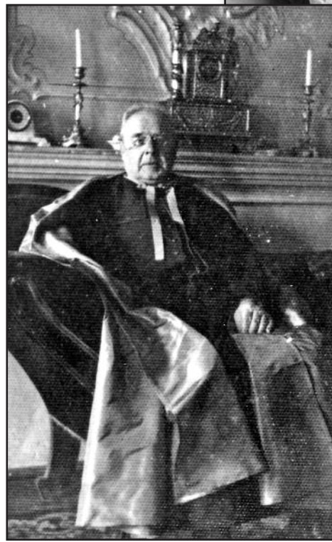
Maironis protonotaro drabužiais savo namuose Kaune, 1931