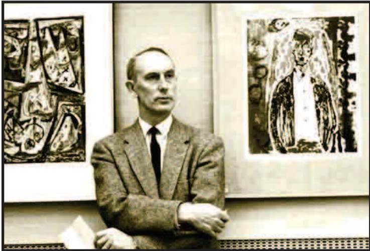
Telesforas Valius tarp savo darbų

Iki ateinančių metų sausio vidurio Vilniuje, Vytauto Kasiulio dailės muziejuje veiks retrospektyvinė žymaus lietuvių grafiko Telesforo Valiaus (1914–1977) darbų paroda, skirta jo gimimo šimtmečiui. Jau rodėta jo jaunystės mieste Kaune, taip pat jo bičiulio Vytauto Kazimiero Jonyno galerijoje Druskininkuose dabar ji atkeliavo į V. Kasiulio muziejų. Tai simboliška – V. Kasiulį T. Valius gerai pažinojo, lankydavosi pas jį Paryžiuje, kuris dailininko kūrybai turėjo didelę įtaką.