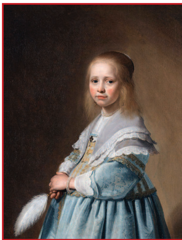
Johanes Verspronck. Mergaitė mėlynais drabužiais, XVII a.

Tėvas Euzebijus, įsitvėręs rankomis sakyklos kraštų, kad neišvirstų netyčia sukosėjęs, išspirdamas iš po kojų kėdute, suteikiančią jo nedidukui stotui orumo, paskelbė rūsčią žinią – laikai eina į pabaigą ir Dievo rūstybė netrukus, gal ne Velykų nesulaukus, užgrius žmoniją kaip dangaus ugnis, išlieta iš sidabrinio angelų dubens. Magdalena, kurios galvelė iš bajorų klaupkų kyšojo kaip juodas nuodėguliukas, sustingo iš siaubo ir atsitūpė ant grindų, ieškodama pagalbos; įsikibo į guvernantės sijoną, kvepiantį pernykščiu šieniu. Panelė Cecilija paprastai nusipurtydavo Magdalena kaip lakišiaus sėk-