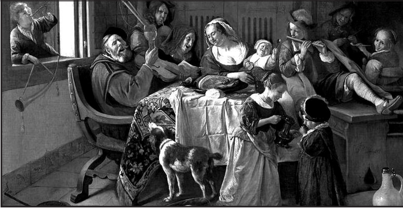
Jan Steen. Laiminga šeima, XVII a.