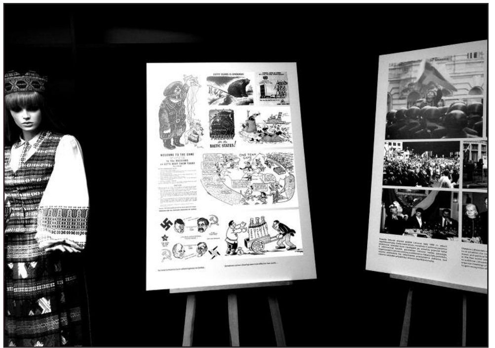
Lietuvių tautiniai kostiumai, vilkėti 1956 m. delegacijos pas viceprezidentą Richardą Nixoną metu.

11-osios trupus pradinis periodas – taip pat turėjo savąjį užnugarį išėivijoje, veiksmingai palaikiusį lietuvių, laisvės ir valstybingumo idėją. Štai ir labiausiai į akis krintantis parodos eksponatas – tautiniai lietuvės rūbai – ne atsitiktinai čia demonstruojamas: jais vilkėta 1956 m. vizito pas JAV viceprezidentą Richardą Nixoną metu... Nors pažymėta, kad įvairių šalių išėivija vienijosi kovai už Lietuvos