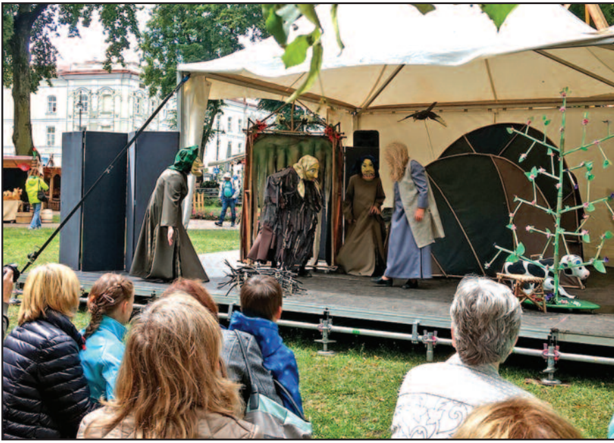
Uteniškų lėlių teatro spektaklis