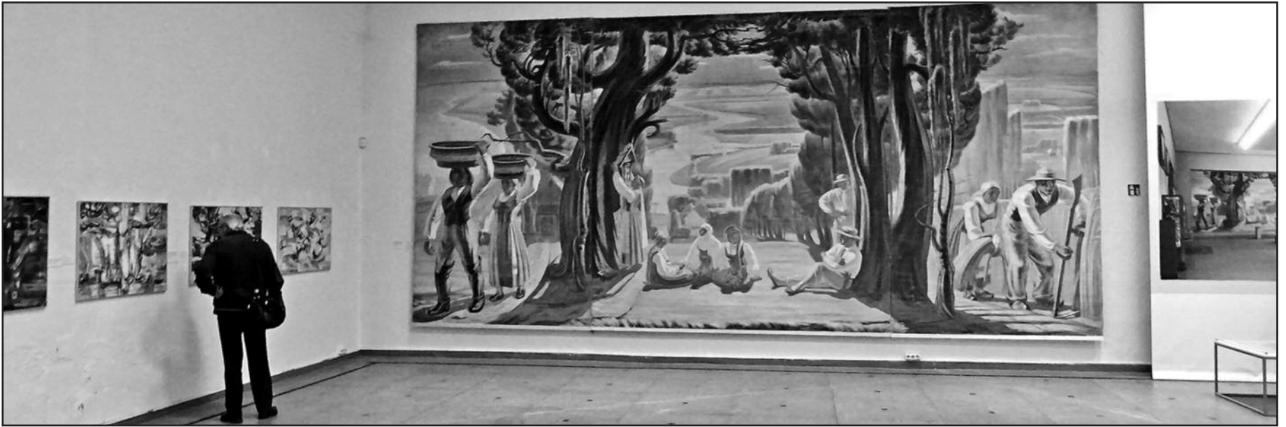
1936–1937 metais sukurtas dekoratyvinis pano „Lietuva“ – pagrindinis naujosios parodos akcentas.