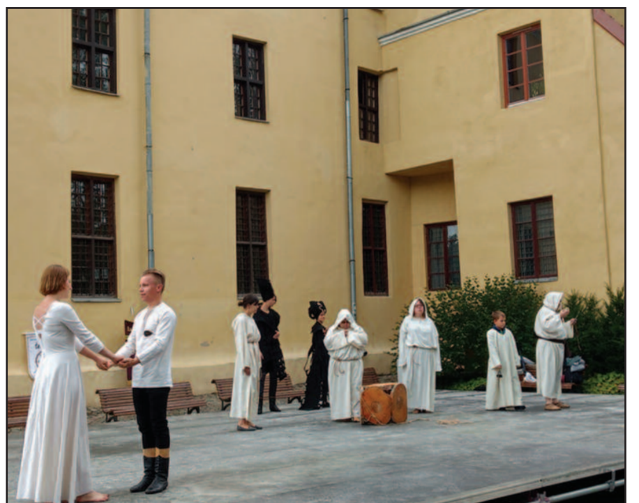
Scena iš spektaklio „Paskutinieji protėvių dievai“ pagal Vydūną