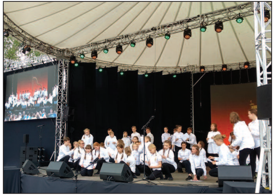
Plungės moksleiviai rašo laiškus Lietuvai