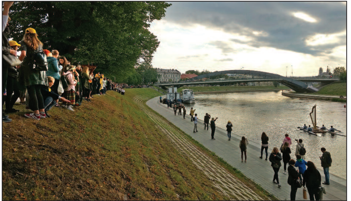
Ateities kartoms Neries upe išplukdoma Vydūno arfa.

Akį paganyti, pasigrožėti, gal kai kur – skoniui neatitikus – tik probėgšmais žvilgtelti, o kai kur sustoti kontempliacijos akimirakai – ši turtinga paroda tikrai siūlo. Joje 53 autoriai iš 19 šalių prisista-