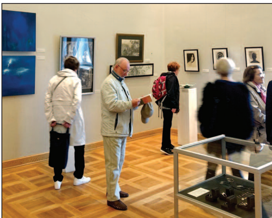
Pasaulio lietuvių menininkų parodos epizodas