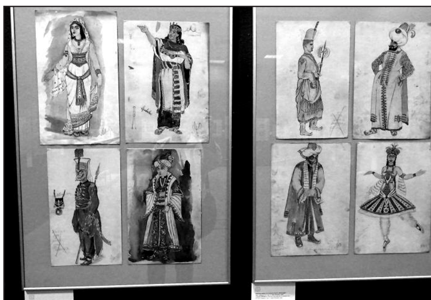
Tarp Adomo Galdiko darbų – ir scenografija.

Jo retrospektyvinėje parodoje Kaune dabar galima išvysti ir garsųjį dailininko darbą – triptiką „Lietuva“, kuris Paryžiaus pasaulinėje parodoje 1937 metais gavo Didįjį prizą. Tai pagrindinis parodos akcentas – per karus ir sovietmetį muziejaus fonduose išsaugotas monumentalus dekoratyvinis pano. Šį darbą muziejui perdavė Lietuvos užsienio reikalų ministerija, o šalia jo lankytojai gali pamatyti ir nuotrauką iš parodos Paryžiuje 1937-aisiais, kurioje matyti triptikas.