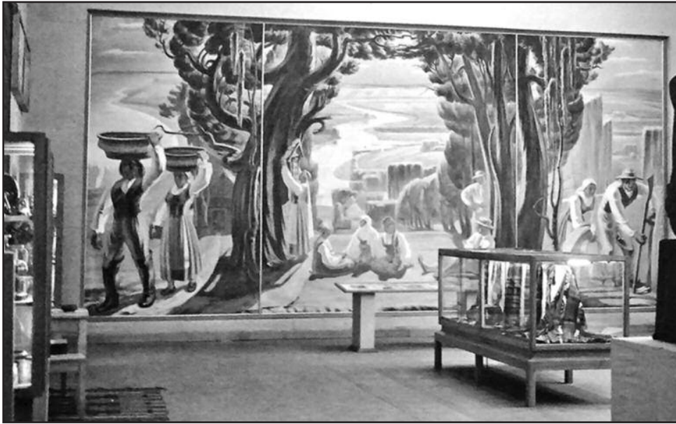
A. Galdiko darbai puošia du Paveikslų galerijos aukštus.