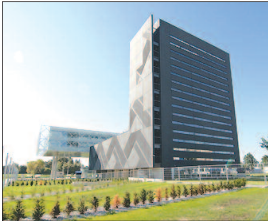
Kauno technologijos universiteto Mokslo ir technologijų centras bei Technologinio verslo inkubatorius – „Santakos“ slėnis.

Kaip šio slėnio gyventojai, galime pasidžiaugti, kad projektas yra labai vykęs, patalpos funkcionalios, patogios, o pats statinys yra šviesus ir jaukus. „Santakos“ slėnis – tai beveik 13 tūkstančių kvadratinė metrų statinys (du penkių ir aštuonių aukštų korpusai), kuriame įsikūrė mokslo laboratorijos ir institutai, konferencijų salės, vestibuliai, ekspozicinės erdvės, taip pat yra požeminė automobilių stovėjimo aikštelė. Mokslinių tyrimų infrastruktūrai paskirta beveik 9 tūkstančiai kvadratinė metrų. Bendra projekto vertė siekė beveik 170 milijonų litų (maždaug 49 mln. eurų), o centre sumontuotos įrangos vertė – 90 mln. litų (maždaug 26 mln. eurų). Slėnyje įsikūrė KTU Sintetinės chemijos institutas, prof. K. Baršausko ultragarso mokslo institutas, Medžiagų