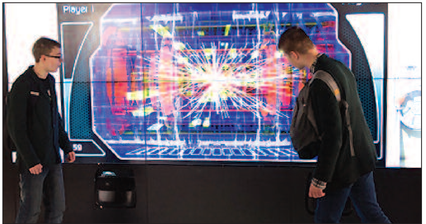
CERN'o parodos mokomasis stendas, leidžiantis interaktyviai „stebėti“ ir „dalyvauti“ įgreitintų elementariųjų dalelių susidūrimo eksperimente

Lietuvoje tarp maždaug 100 000 studijuojančiųjų, greta informacinių technologijų, biomedicinos, ekonomikos studijų tradiciškai išlieka populiarios inžinerinės ir gamtos mokslų studijos. Visa tai lemia, kad Lietuvoje daug metų sėkmingai veikia įmonės, savo produkcija sėkmingai konkuruojančios pasaulinėje rinkoje. Čia reiktų paminėti Lazerių mokslo ir technologijų asociaciją (16 mokslo institucijų ir įmonių), Fotovoltinių technologijų ir verslo asociaciją (22 mokslo institucijos ir įmonės). Istorikai bene didžiausia pažanga nuo Nepriklausomybės paskelbimo buvo pasiekta lazerių technologijos srityje. Pavyzdžiui, uždaroji akcinė bendrovė „Šviesos konversija“, pradėjusi savo veiklą kaip Vilniaus universiteto pumpurinė įmonė, tapo viena iš žinomų pasaulyje įmonių, gaminančių femtosekundinius lazerius medžiagų apdirbimui, parametrinius stiprintuvus ultrasparčiai spektroskopijai. Paminėtinos Lazerių mokslo ir technologijų asociacijos įmonės: UAB „Ekspla“ (gaminanti lazerius ir sistemas mokslo reikmėms, gamybinius pikosekundinius lazerius, ultrasparčius skaidulinius lazerius, lazerines spektroskopines sistemas ir optoelektronikos komponentes), UAB „Eksma Optics“ (optinės komponentės, optinės sistemos, netiesiniai kristalai lazeriams), UAB „Standa“ (optiniai elementai lazeriams, diodais kaupinami lazeriai) ir kt. Šios sėkmingai dirbančios įmonės siūlo mokslininkams ir verslininkams efektyvius įrankius, reikalingus nanotechnologijose.