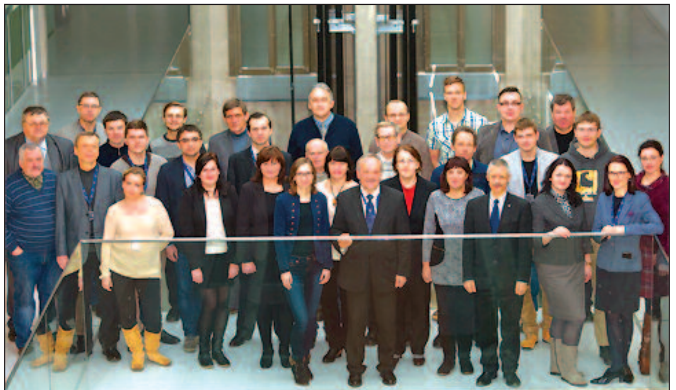
KTU Medžiagų mokslo instituto tyrėjai, doktorantai ir studentai