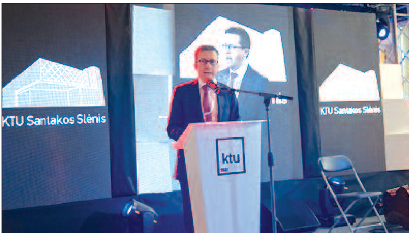
Pranešimą skaito Carlos Moedas, Europos komisaras mokslininkams, inovacijoms ir mokslui.

Tai tik keletas pavyzdžių, o jų turime ir daugiau – taigi mūsų optimizmas pagrįstas. □