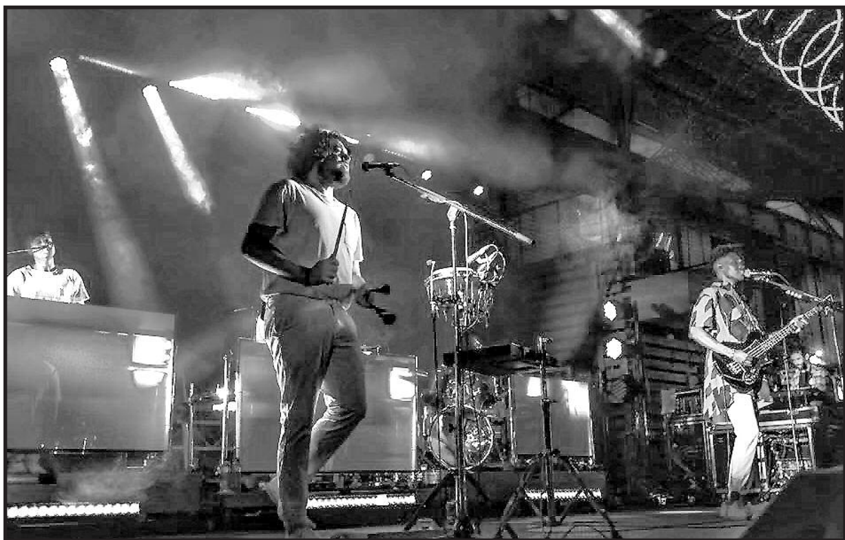
Grupė „Metronomy“ iš Anglijos.

Plačiau – apie įdomiausias pasirodymus. Pirmas – tai muzika. „Metronomy“ grupė iš Anglijos buvo ne reali staigmena visiems, kurie taip jaudinosi ir bijojo dėl to, kas galėtų pakeisti tokios populiarios „Glass Animals“ grupės vardą, o gera koncerto nuotaika neapleido iki paskutinės dainos akordo. Grupės, palikusios didelį įspūdį – mylimieji „Carnival Youth“, „Kedrostuburas“ (visiškai šviežia lietuviškojo indie roko grupė, kuri šiais metais laimėjo NOVUS naujų grupių pasirodymus ir savo vietą tarp pripažintų lietuviškų grupių vardų). Kiek žymesnis – „Garbanotas bosistas“, kuris kuo toliau, tuo labiau ne tik patinka Lietuvos publikai, bet ir kuria naujas melodijas, tobulina senąsias ir vis dažniau pasirenkamas kaip apšildančioji grupė dideliems, į Lietuvą koncertuoti atvykstantiems vardams iš viso pasaulio (neseniai šiai grupei teko garbė apšildyti Naujosios Zelandijos megagrūpę „Unknown Mortal Orchestra“, „Timid Kooky“ – grupė, atliekanti kiek kitokią muziką žanrą, nei man patiktų, bet jų talento nepastebėti yra neįmanoma; be galo gerai „besiplėšanti“, deganti aistra dainuoti ir koncertuoti. Vis daugiau populiarumo ir žinomumo pritraukiantys „Flash Voyage“ (mano subjektyvia