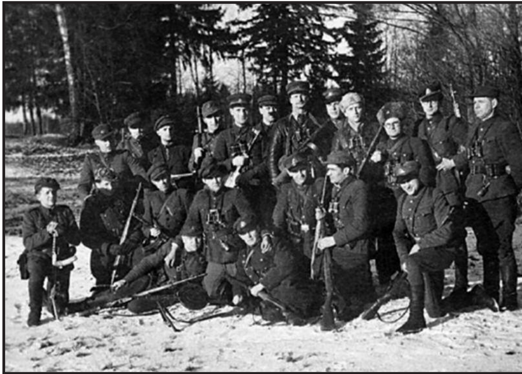
Lietuvos partizanų vadų suvažiavimas

Už vis keisčiausia, kad knygoje net neužsimenama apie bene svarbiausią valdžios planą rusifikuoti žemėvaldą, 2/3 žemės sutelkti rusų rankose. Šiam tikslui pasiekti buvo panaudotos įvairiausios priemonės: dvarų konfiskavimas ir sekvestravimas, kontribucijos ėmimas, draudimas katalikams ir žydams pirkti, ikeisti žemes, jiems taikyta kreditinė diskriminacija ir kt. Žemė kolonistams pardavinėta pusvelčiui, jiems teiktos lengvatinės paskolos. Valstybinio bajorų ir Valstiečių žemės banko padaliniai Lietuvoje buvo paversti kolonistų įkurdinimo finansiniais centrais. Geriausios žemės buvo