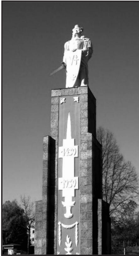
Paminklas Vytautui Didžiajam Perlojoje, pastatytas 1931 m.

K laudingai teigiama, kad „1949 m. daugiau kaip pusė visų Lietuvos valstiečių išiskolino valstybei už pieną ir mėsą <...>“ (p. 341). Negi valstiečiai buvo pasiskolinę iš režimo pieno ir mėsos ir vengė šias skolas gražinti! Nutylėta šių „skolų“ atsiradimų priežastis – kaimiečių nepajėgumas atlikti be paliovos didintas prievoles. Juk ūkininkai buvo nustepti nuo 1940 m. nacių ir sovietų didžiulėmis prievolėmis, mokesčiais, gyvulių revizicijomis, daug ūkių buvo sugriauta karo dienomis, apiplėšti kariuomenių ir kt. Jaunos kartos skaitytojai nelabai suprast ištarę, jog „kolūkietis, gaudamas menką atlygį už darbadienius, pragyveno iš 0,6 ha sodybinio žemės sklypo, iš kurio gaudavo net apie ¼ savo pajamų.“ (p. 341). Šitaip formuluoju teiginį, išnyksta tragiška tuometinė kolchozninkų padėtis, pusbadžiavimas. Tada nesuprasi, kodėl visais įmanomais būdais žmonės bėgo į miestus. Toliau istorikas moralizuoja: „Kolūkiuose dirbdami per prievartą valstiečiai nesistengė dirbti sąžiningai <...> pradėjo vogti <...> neliko pagarbos darbui. Smuko aukšta tikinčiojo Dievą valstiečio moralė, kai kurie savo sunkią dalį ėmė malšinti degtine“ (p. 341). Įdomu, kaip būtų elgęsis moralizuotojas, jei jo vaikai pusbadžiautų, jei pagrindinė maitintoja karvė negautų paėsti bent šiaudų, mirktų tvarto srutose. Todėl žmonės buvo priversti vakarais nešti iš kolchozo šiaudus, į kišenes prisipilti grū-