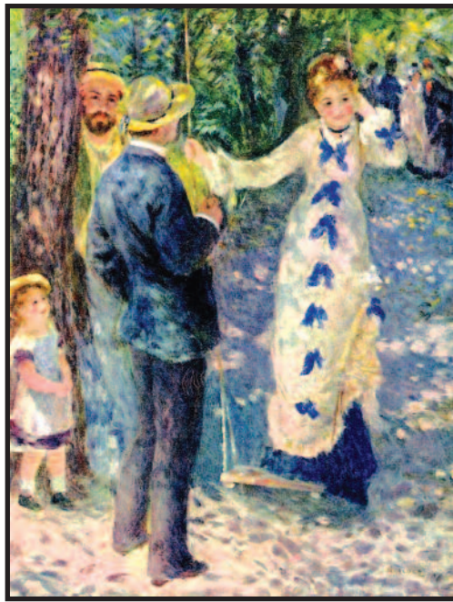
Pierre-Auguste Renoir. Sūpynės

Gyvenimą baigė Panevėžyje, labai skursdama, vieniša, tačiau galėjo daugiau laiko skirti rašymui. Nuo 1925 metų parašė daug atsiminimų iš savo gyvenimo ir veiklos, 1933 m. sukūrė romaną „Ad astra“, kuriame nemažai autobiografinių motyvų. Iki pat gilios senatvės klausėsi radijo, domėjosi šalies gyvenimu. Mirė 1943 m. sulaukusi 83 metų. □