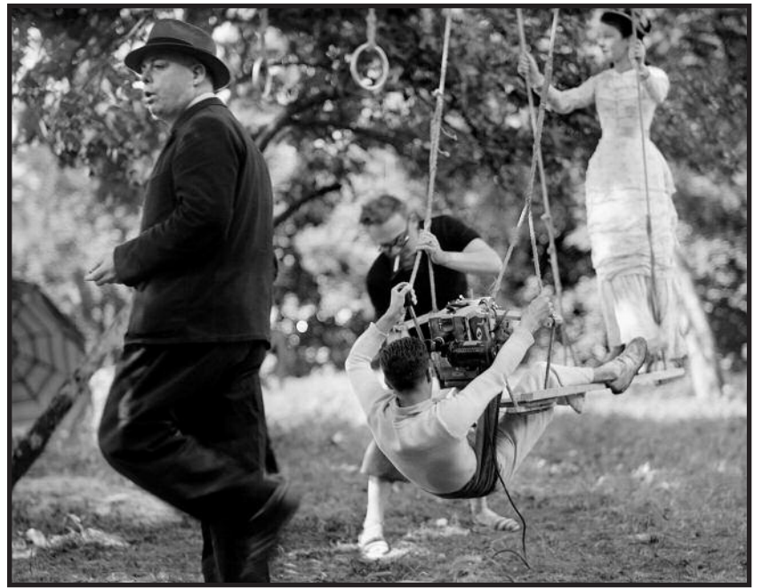
Jean Renoir. „Sūpynės“ kino kalba