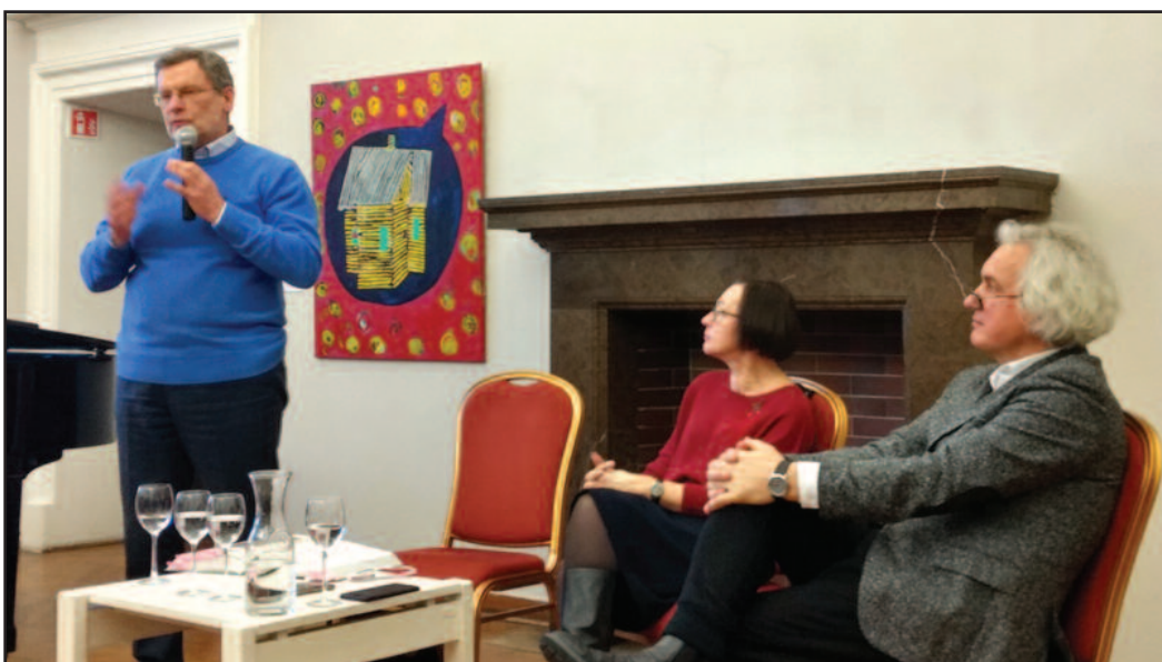
Leidinį pristato autorius.

Bet tai ištis stebinant, bei turtinantis – žiniomis ir vaizdais – leidinys.