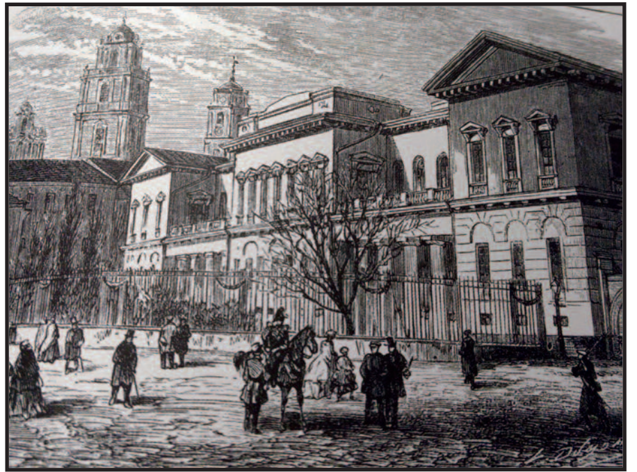
Medžio raižinys pagal Korzono nuotrauką

Tik – patriotinės ir opozicinės caro valdžiai nuotaikos Lenkijoje ir Lietuvoje (ir čia, regis, daugiausia „lenkiškos“) kaista; Vilnius atsišaukia į