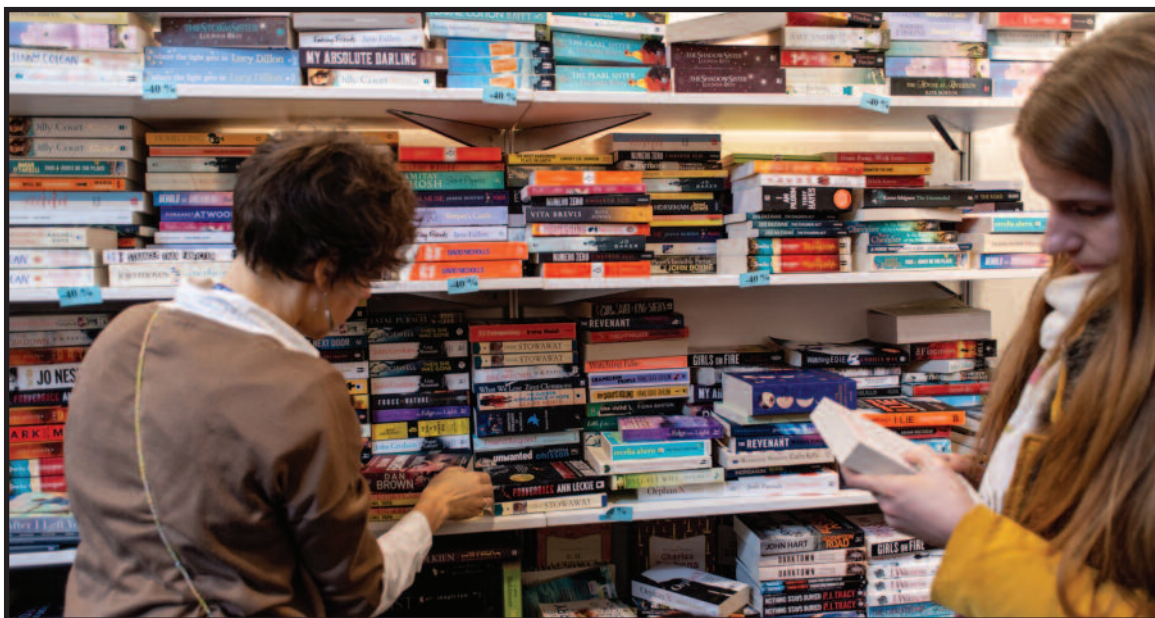
2019 m. Vilniaus knygų mugė