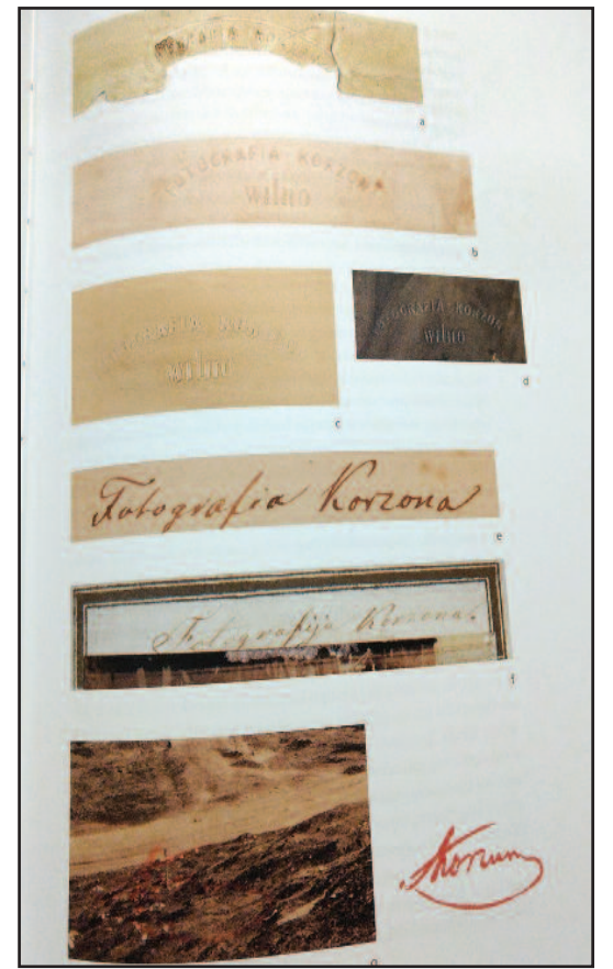
Korzono naudotų reljefinių įspaudų ir jo parašų pavyzdžiai

Visos nuotraukos autoriaus dar kart pateikiamos „abėcėliniame kataloge“. Po jo regime ir pluoštelį archyvinų dokumentų: štai Korzono parodymų tardyme protokolas, jo rašyti