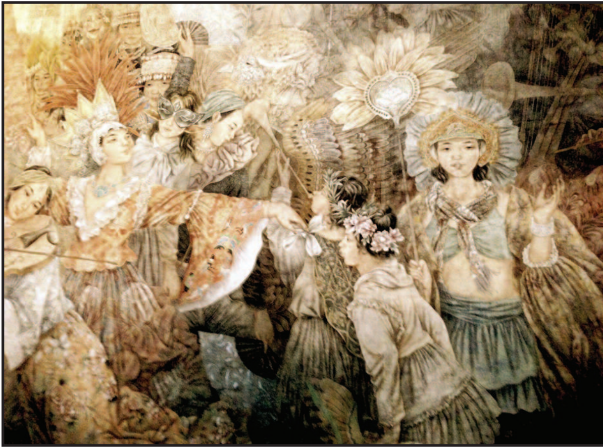
Cui Jin tapyba tušu „Nepaprastas reginys“