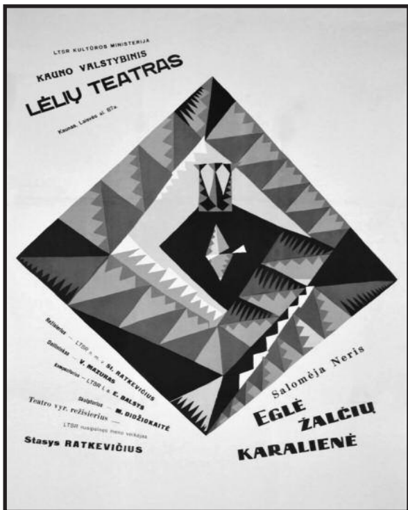
Legendinio spektaklio plakatas