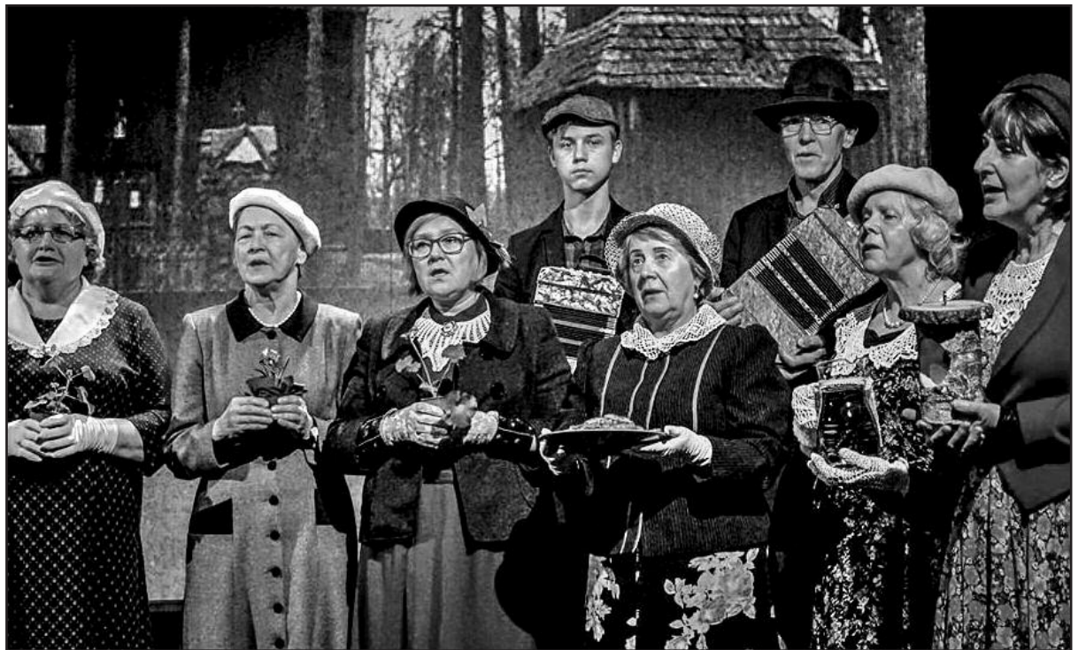
Akimirka iš „Pempinių“ Kauno miesto kameriniame teatre.