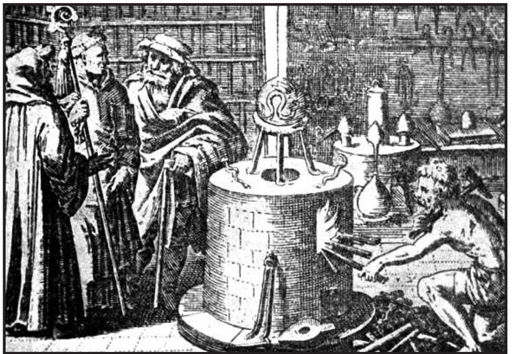
Viduramžių alchemiko laboratorija.

Jeigu taip manote, neikite į vaistinę. Kai susirgsit, darykit pritūpimus. Ir pasimurkykite eketėje pilnaties metu.