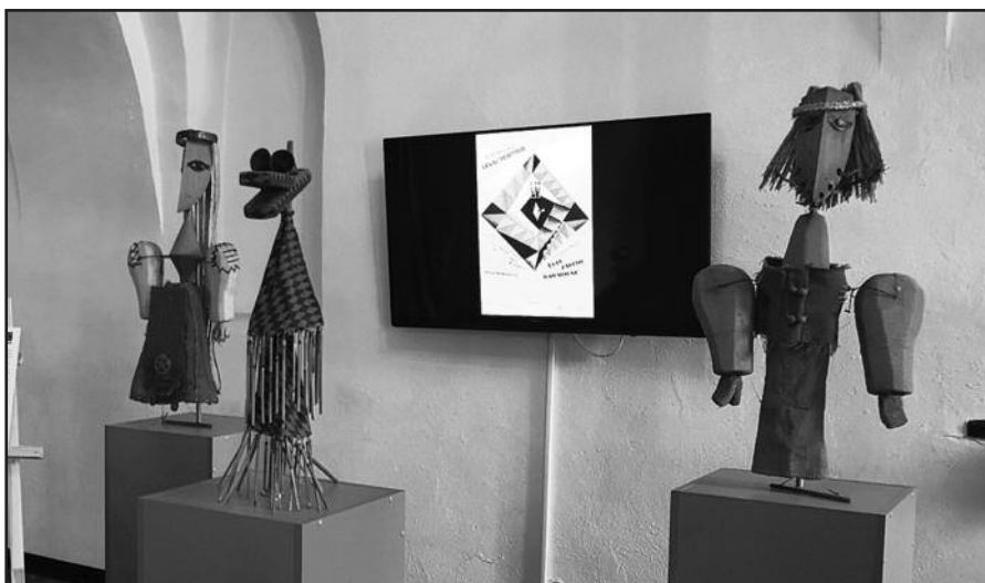
Spektaklio „Eglė žalčių karalienė“ lėlės išsaugotos 50 metų

Kauno miesto muziejuje Rotušėje lankytojus pakvietė neįprasta paroda, kurioje pristatomos Kauno valstybinio lėlių teatro spektaklio „Eglė žalčių karalienė“ lėlės. Įdomu tai, kad šios lėlės yra išsaugotos daugiau kaip 50 metų – spektaklio premjera įvyko dar 1968 metais. Šis legendinis Kauno valstybinio lėlių teatro spektaklis 1968-aisiais antrajame Baltijos šalių lėlininkų festivalyje Latvijos sostinėje Rygoje sulaukė didžiulio pasisekimo ir buvo apdovanotas kaip geriausias nacionalinis spektaklis. Jis taip pat pirmą kartą atstovavo profesionaliam