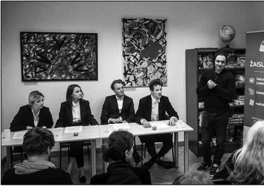
Skaitoma būsimo spektaklio „Kandidas arba optimizmo mirtis“ ištrauka