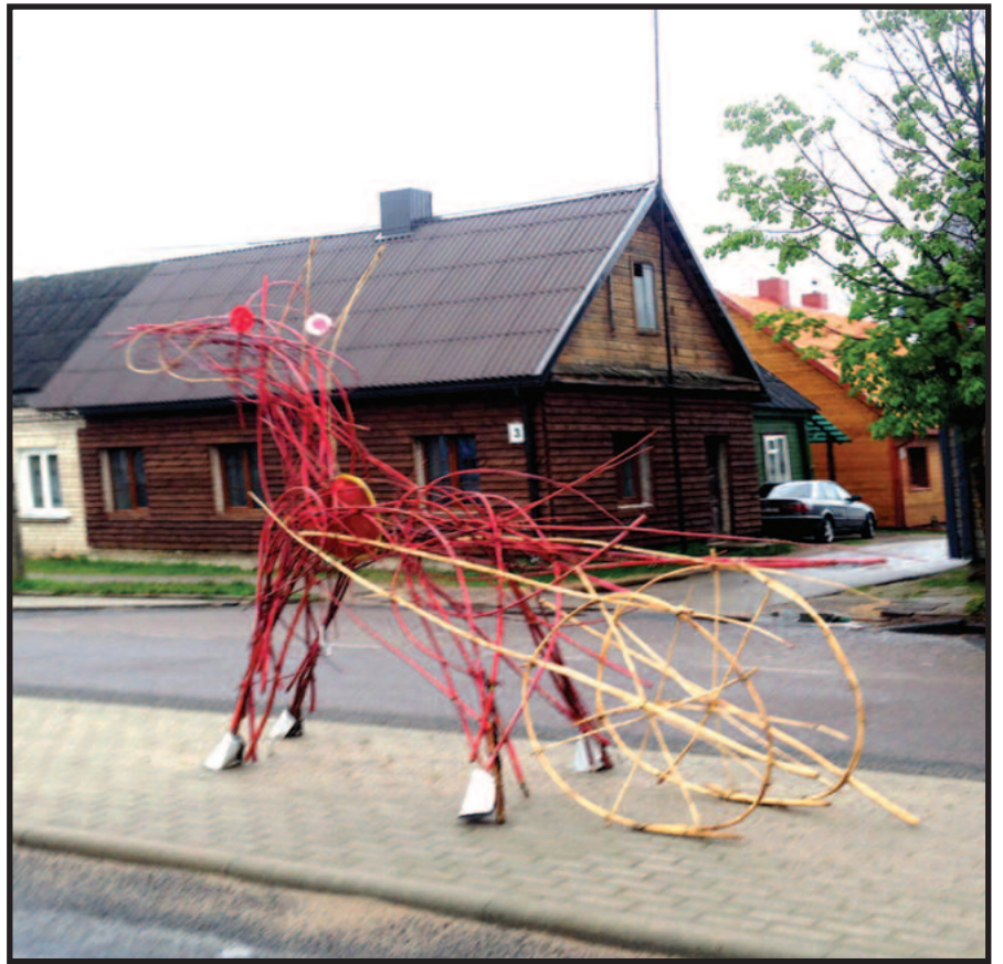
Dusetų simbolis – medinis arkliukas.