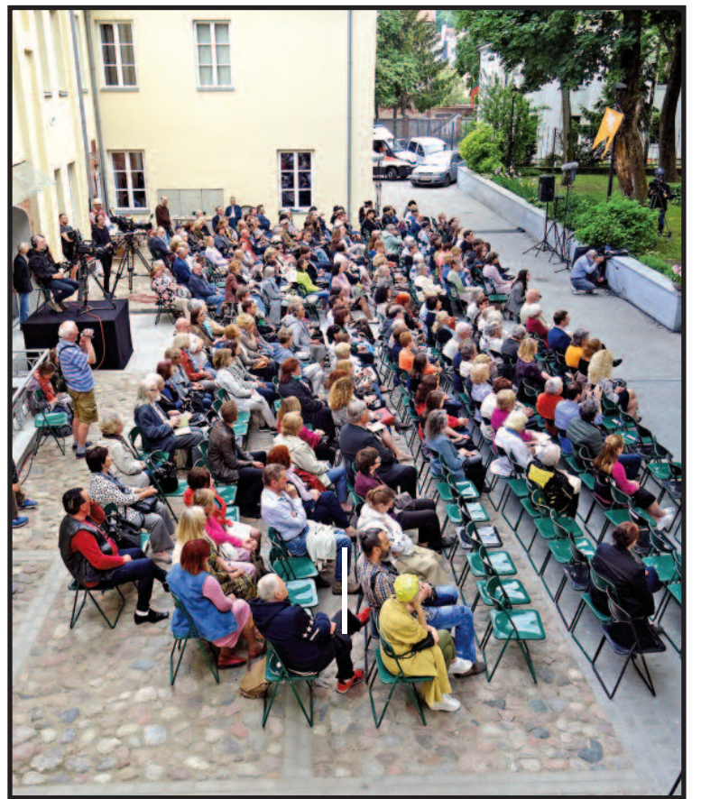
Poezijos mėlėtojai muziejaus kiemyje

Tai, kad K. Donelaičio „Metai“ nepaseno ir reikalingi, įrodo ir paskutinį gegužės šeštadienį Paryžiuje surengtas „Metų“ vertimo į prancūzų kalbą pristatymas, kuriame dalyvavo kūrinių vertėja Ka-