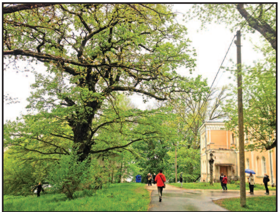
Glitiškių ąžuolas prie Glitiškių dvaro

Tūkstantmetis gamtos stebuklas. Pro rapsų ir pieinių laukų geltonį važiuojame toliau. 40 km nuo Dusetų – Stelmužė ( Stela muiža latviškai – žvaigždės