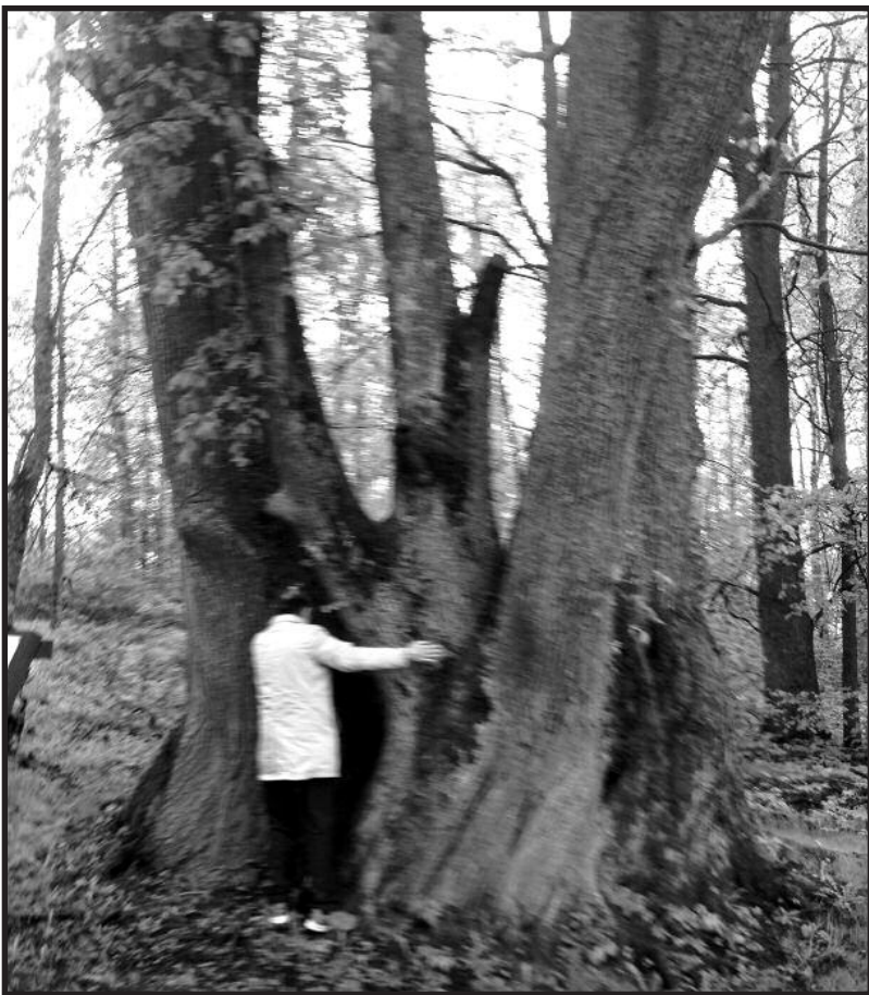
Daugiakamienė Dusetų vinkšna

Medžių lajų tako naujiena susijusi su A. Baranausko išgarsintu Anykščių šileliu – miškas ar poema? Šiuo metu Aukštaitijos nacionaliniame parke išradinigi dizaineriai rengia senovinės bitininkystės ekspoziciją (korių struktūra, bičių gyvensena, kt.).