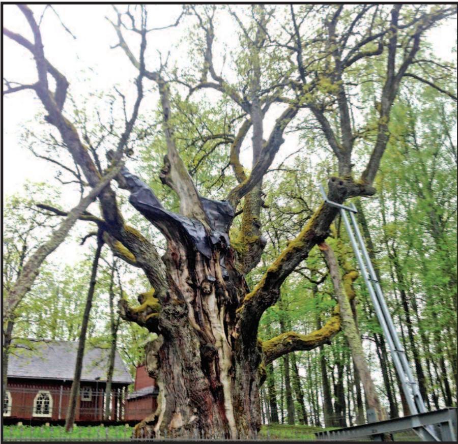
Taip dabar atrodo senolis Stelmužės ąžuolas