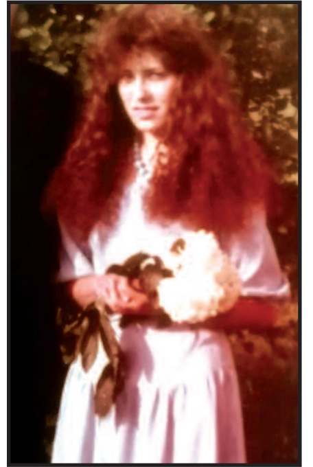
Romano autorė – Šimonių (Kupiškio raj.) vidurinės mokyklos abiturientė, 1988 m.