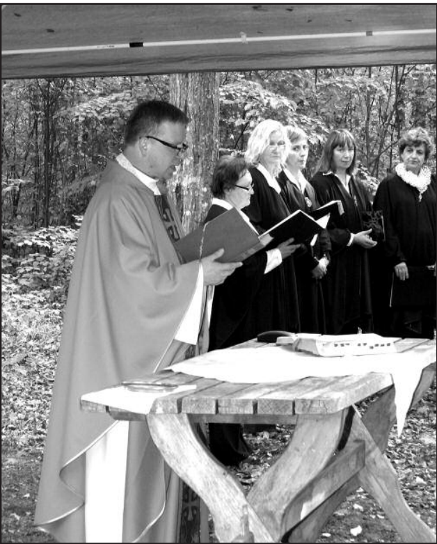
Mišios prie Šaravų ažuolo

Geiščiūnų (Alytaus r.). Skersmuo 2 m, aukštis 20 m, Nemunaičio apylinkėje, Geiščiūnų kaime. Ažuolas matyti iš tolo, nes auga prie kelio, aukštumėlėje. J. Tamašauskas pasakojo, kad XIX a. iškirtus mišką, jis buvo paliktas lauke. Prie jo senais laikais sustodavę elgetos, jaunimas rengdavo gegužines.