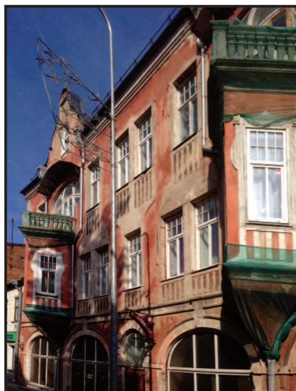
Išlikę autentiško stiliaus Daugpilio pastatai (jugendo stiliaus)

likelėse. Mieste gyvena daug tautybių, yra lenkų, rusų, baltarusių kultūros centrai ir lietuvių bendruomenės namai.