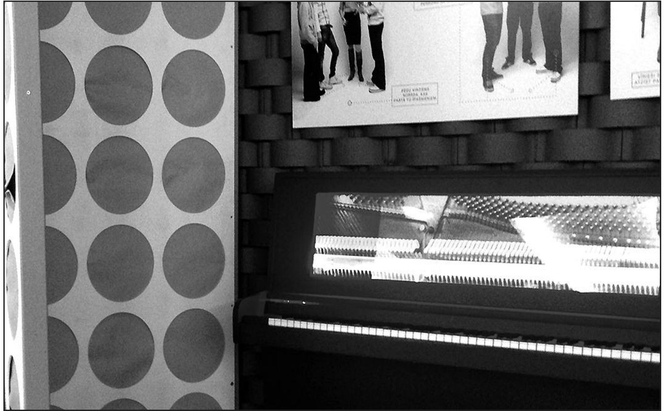
Persiviečiantis veikiantis pianinas Zino Daugavpils

metrų ilgio, pločio ir pusketvirto metro aukščio).