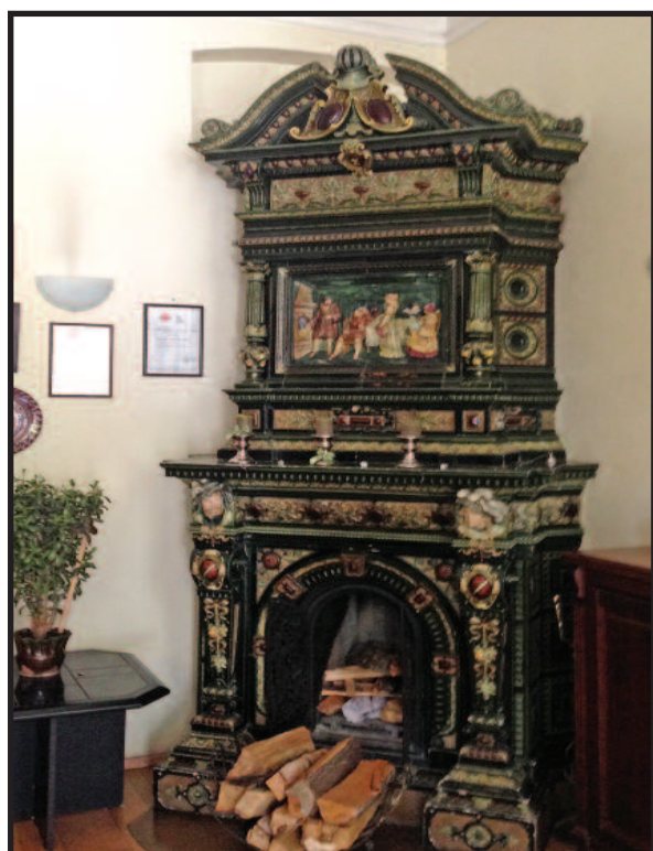
Senovinė grafų laikus menanti krosnis viešbutyje, atstatytoje Pliaterių rezidencijoje