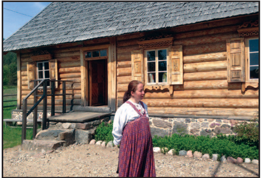
Slutiškio kaime – autentiška sentikių gyvenvietė