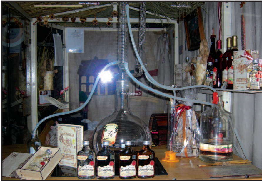
Šmakovkos muziejaus produkcija