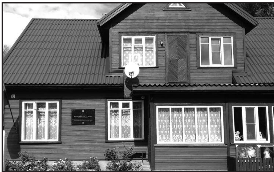
J. Žemaičio- Vytauto namas Šiluvoje