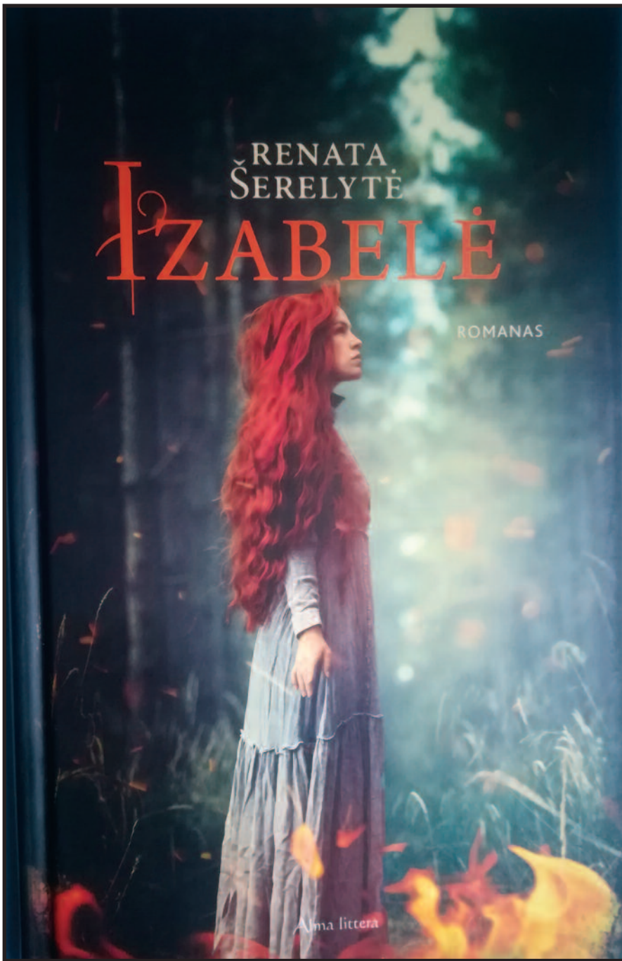
Renata Šerelytė. Izabelė . Romanas. – Vilnius, Alma littera, 2019