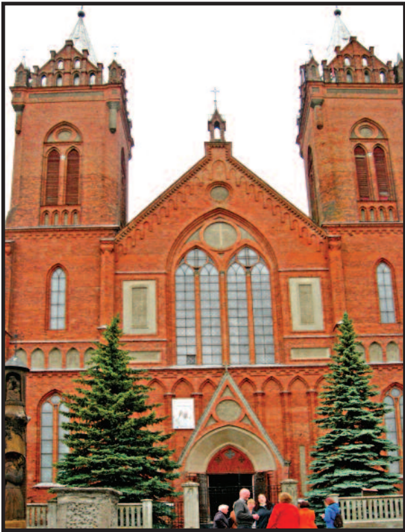
Kupiškio Kristaus Žengimo į dangų bažnyčia