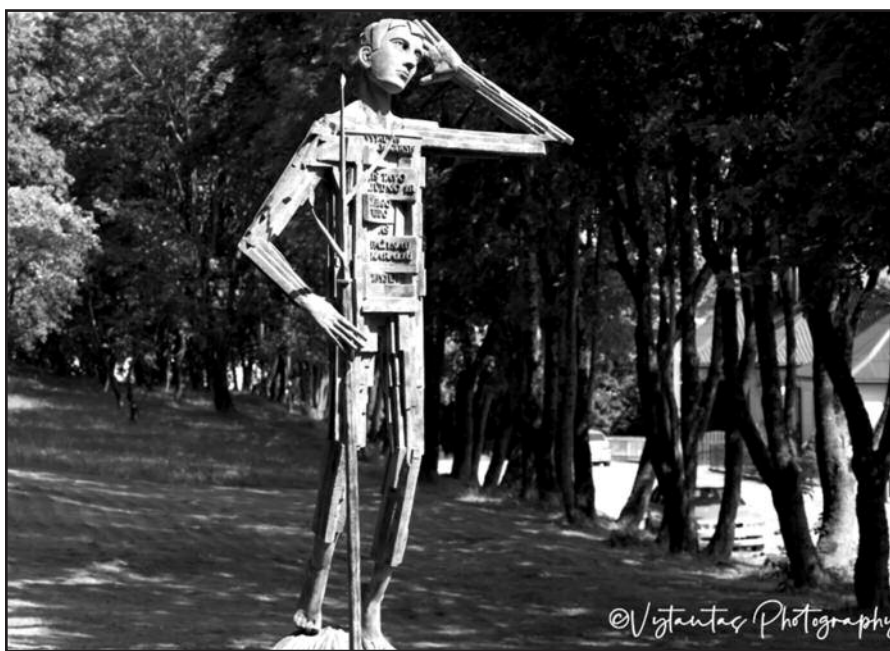
Paminklas Vytautui Mačerniui.