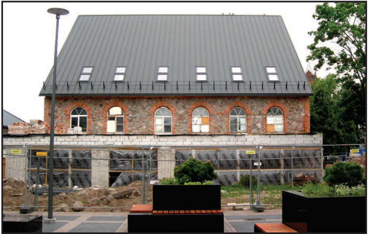
Atstatoma žydų sinagoga

retus atidavė į Šiaulių „Aušros“ muziejų, tačiau, deja, tas faktas neužfiksuotas.