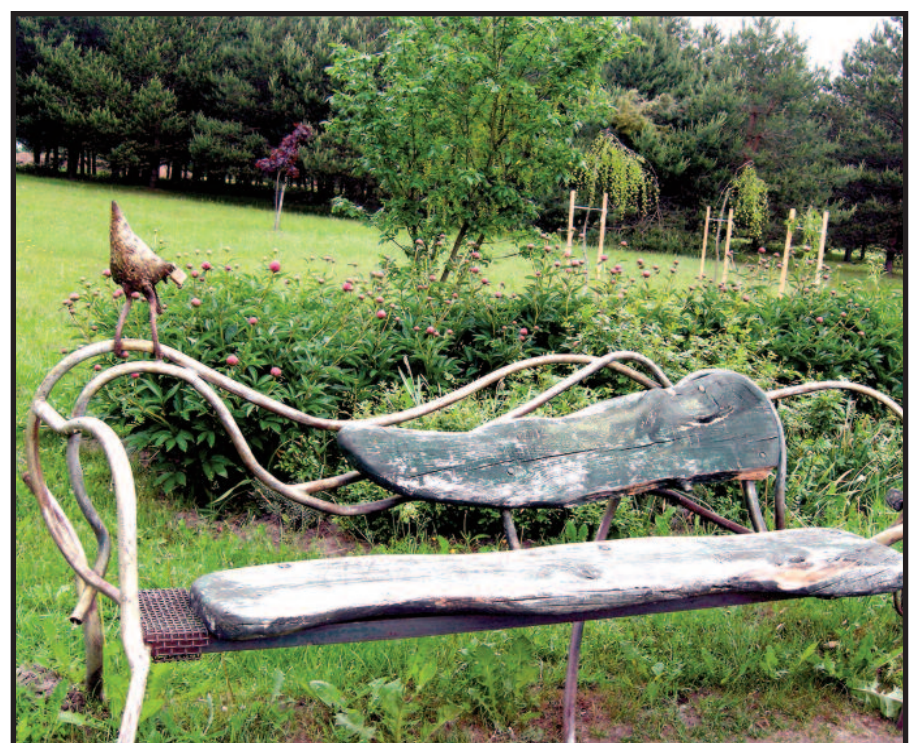
H. Orakausko suolelis.