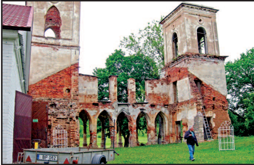
Palėvenės dominikonų vienuolynas