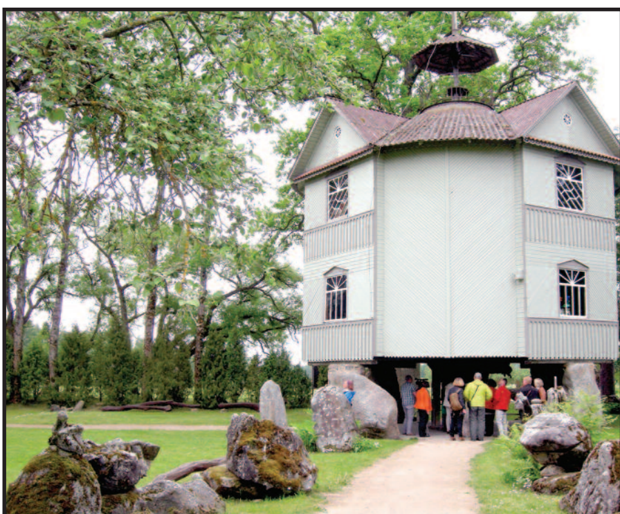
Adomo Petrausko muziejus Uoginiuose bokštas