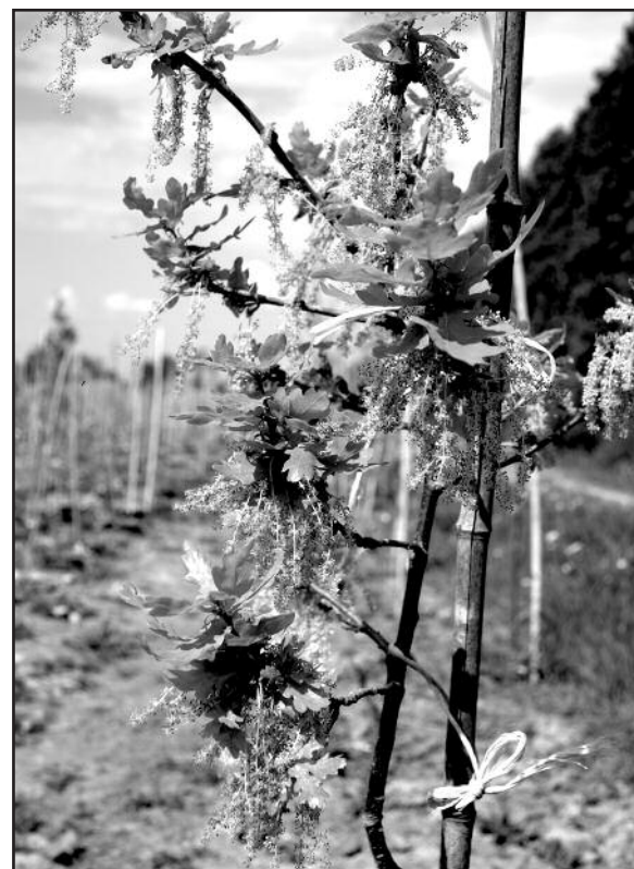
Žydintis seno ąžuolo klonas

Apie Perkūno ąžuolą žinoma legendų. Viena