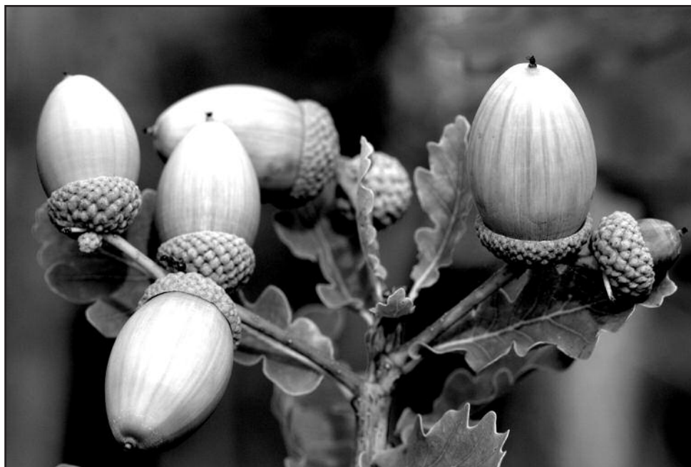
ąžuolo milžino gilės

ąžuolą mėgo ir aplankydavo Sidabrave 1905–1906 metais kunigavęs Vaižgantas.