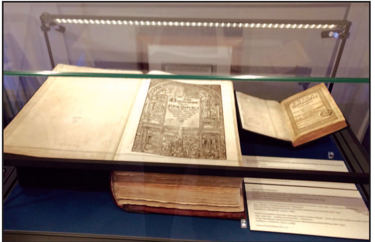
Radvilos Juodojo išleista Brastos Biblija