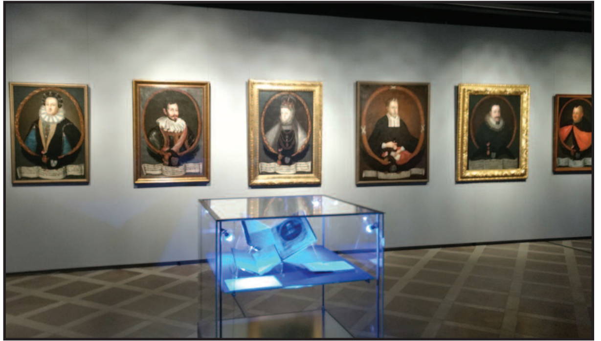
Radvilų giminės portretų galerija.

Ekskursijos organizuotos dviem paraleliais srautais – lenkiškai (būta ir gausaus svečių būrio iš Lenkijos) ją vedė parodos kuratoriai, lietuviškai –