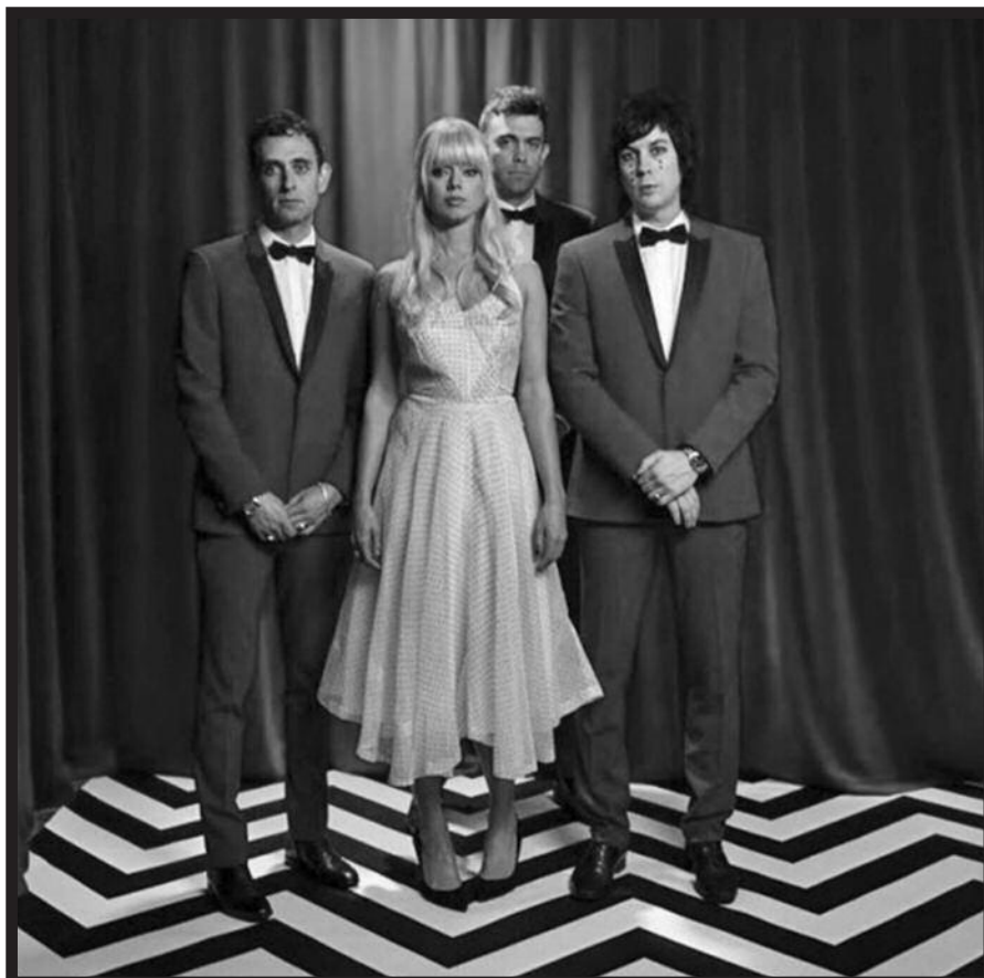
„Chromatics“ seriale „Twin Peaks“

Vienintelis toks grupės pasirodymas Lietuvoje įvyko visai neseniai, o nespėjusiems pamatyti jo čia, per ateinančius mėnesius dar bus galimybė juos išvysti Varšuvoje, Vienoje, Paryžiuje, Londone, Dubline, Amsterdame ir daugybėje kitų Europos miestų. Nepraleiskit!