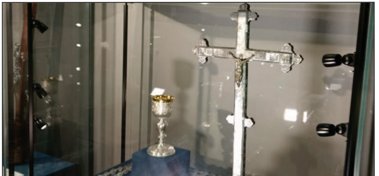
Radvilos Našlaitėlio katalikiškieji eksponatai

m. Karaliaučiuje lotynų kalba publikuotą – netrukus pasirodžiusį ir vokiškai, ir lenkiškai – leidinį Due Epistolae („Du laišakai”). Tai aštri kunigaikščio polemika su popiežiaus nuncijumi