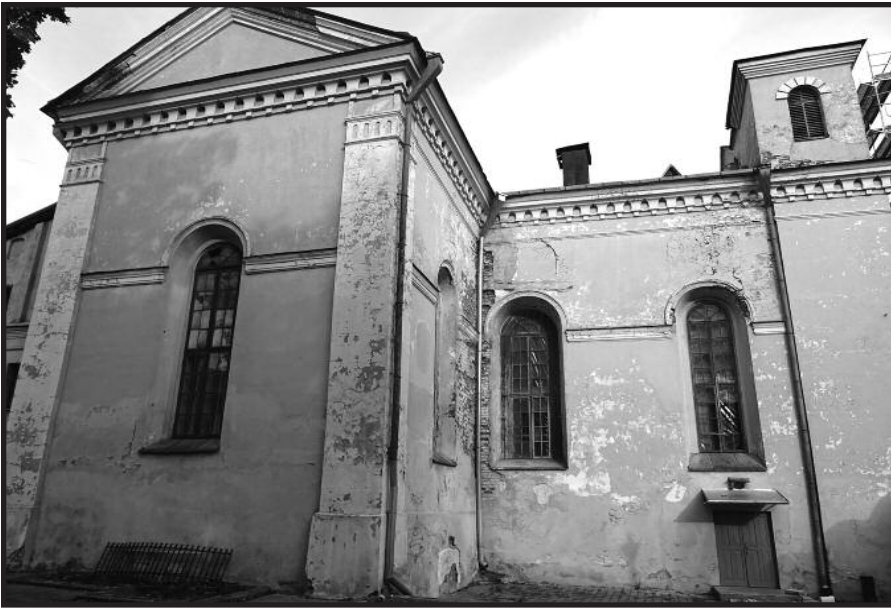
„Sakramento“ erdvė pamažu atsiveria lankytojams.