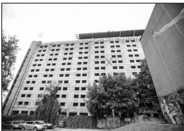
„Britaniką“ iš vidaus daugelis lankytojų pamatė pirmą kartą

„Dabar jaučiamas visuomenės susidomėjimas architektūriniais procesais, įvairūs projektai sulaukia paklausimų, protestų. Šių metų tema tikrai įdomi, ir norime festivaliu parodyti, kad miestą kuria ne tik architektai, bet labai daug įvairių žmonių, tarp jų ir miesto gyventojai, su kuriais reikia derinti projektus, nors nebūtinai paprastų žmonių vizijos sutampa su miesto architektų vizija“, – apie šių metų „KAFė 2019“ festivalio temą kalbėjo G. Balčytis.