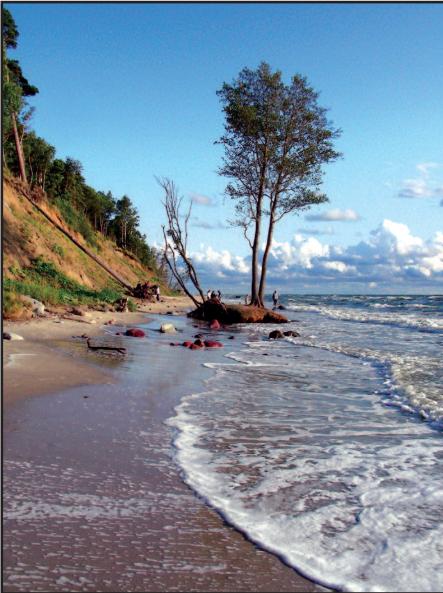
Jūra ties Olando kepure

Po Žalgirio mūšio (1410 m.) ir po Melno taikos (1422 m.) gyvenimas tapo ramesnis. Galutinai buvo nustatytos sienos tarp Ordino ir Lietuvos. XV a. antroje pusėje buvo susirūpinta gyvenviečių steigimu.