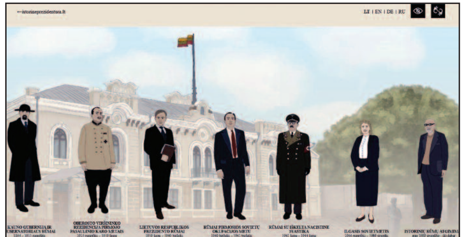
Istorinė Prezidentūra Kaune primena rūmų istorijas