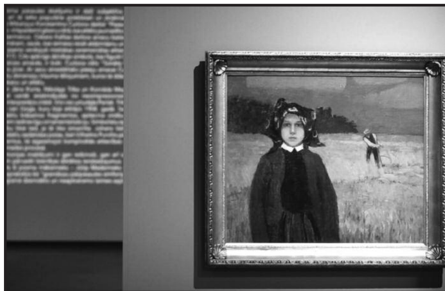
Baltijos simbolizmo paroda – virtualiai