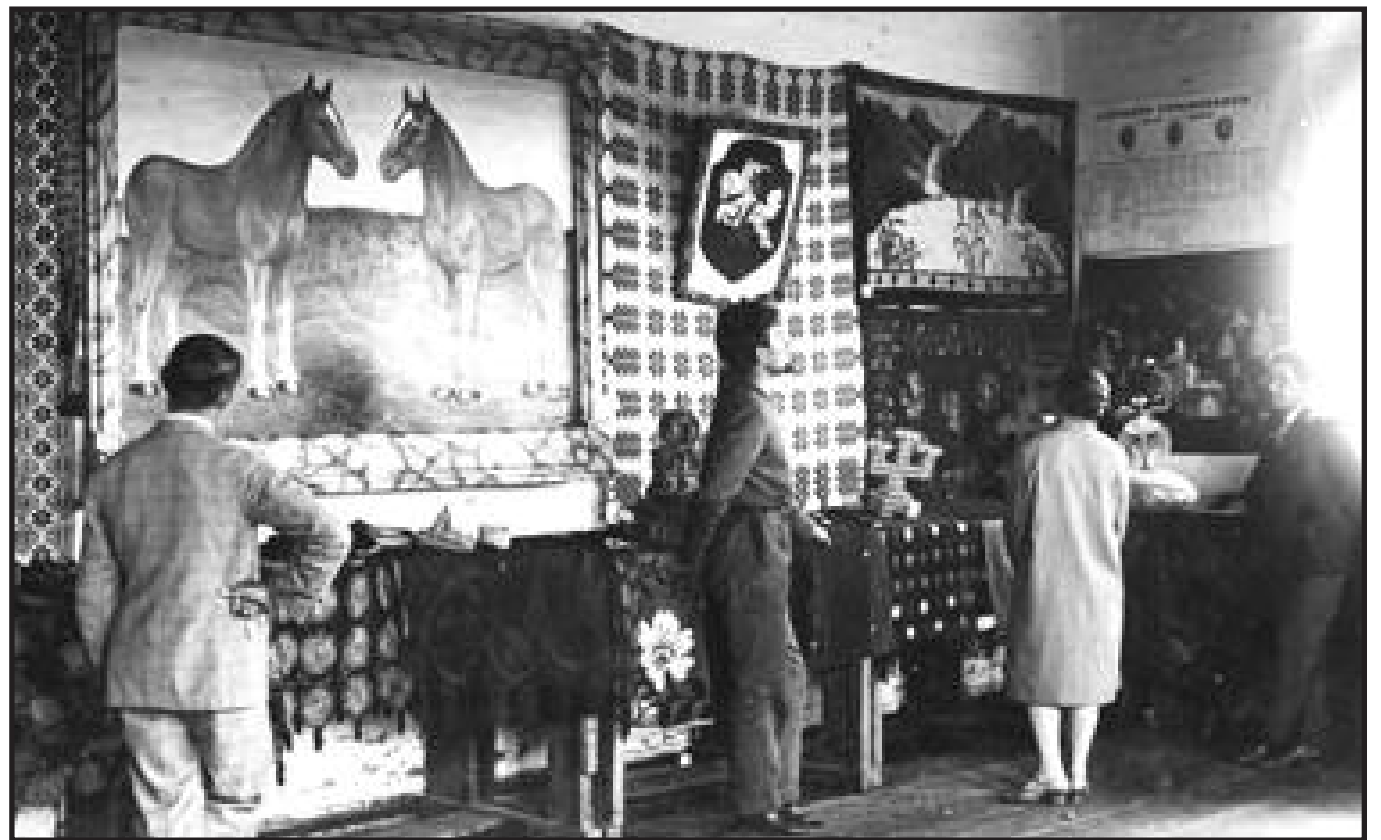
Parodos apžiūrėjimas ir Zanavykų muziejaus lankymas. Pirmasis Zanavykijos katalikiškojo jaunimo kongresas Šakiuose, 1930 m. liepos 20 d.