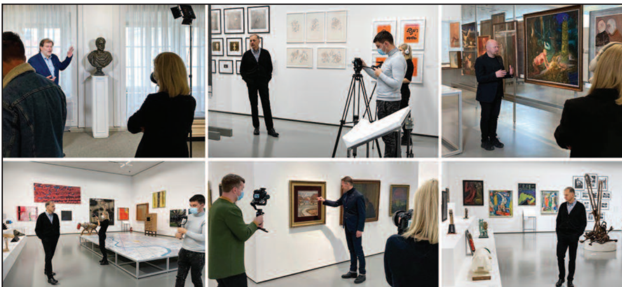
Eksponatus pristato žinomi žmonės.

Kol muziejus negali pakviesti apsilankyti, ekspozicijos pristatymas tęsiamas virtualiai supažindinant lankytojus jus su kiekvieno laikotarpio išskirtiniais menininkais bei jų kūriniais.