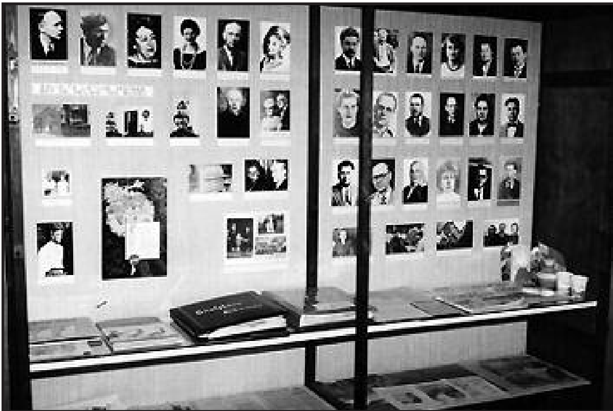
Išeivijos ekspozicija Zanavykų krašto muziejuje, XX a. 10 deš.