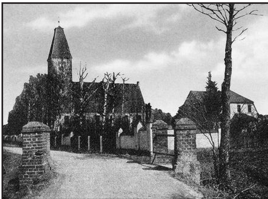
Buvusi Karklės bažnyčia.