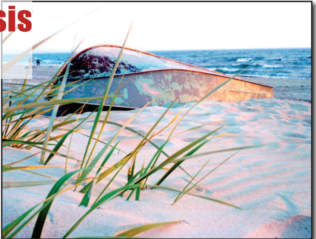
Peizažas su valtimi.