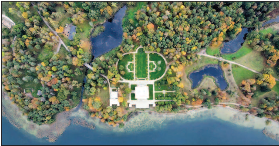
„Dvarų dėlionėje“ – ir Paežerių, Užutrakio dvarai