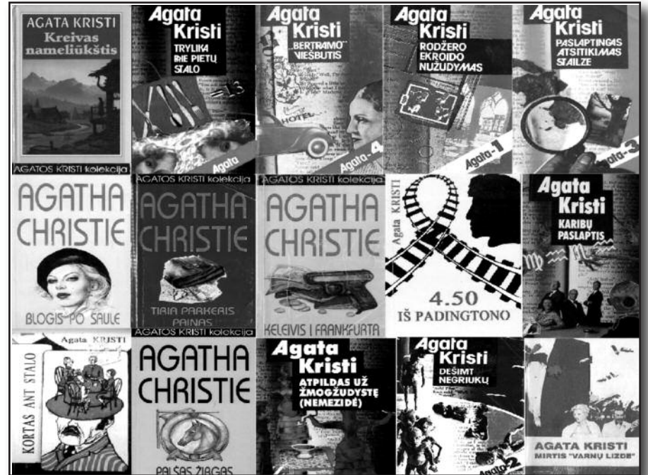
Agathos Christie kūrinius Lietuvoje leidžia leidykla „Sirokas“

Kuo ši nepralenkiama intrigos meistrė, pelnytai vadinama detektyvų karaliene, tokia patraukli ir paprastam, ir išsilavinusiam skaitytojui? Visų pirma, kompaktiška savo kūrinių forma – jos siužetai tobuli, neperkrauti nereikalingais veikėjų psichologiniais išgyvenimais ar šalutinėmis pasakojimo linijomis, neturinčiomis su nusikaltimu nieko bendra. Jos kūrinių kalba itin paprasta, galima sakyti, kasdieniška, bet labai tiksli ir suteikianti sakiniui tą spalvą ir niuansą, kokio reikia. Jos personažai – gyvi ir empatiški, jų psichologinės charakteristikos itin tikslios. Agatha skaitytojo nugramzdins į kraupią, depresyvią ezoteriką, pagrįstą likimo piršto bausme ar kokia kita dūmų uždanga, o su humoro jausmu parodys, kam būtų naudinga ir kodėl, kad jūs tuo tikėtumėte (puikus pavyzdys – apsakymas „Mėlynosios vazos paslaptis“). Žudikas gali prisistatyti pirmuoju pasakojimo sakiniu, tik jūs, aišku, to nė neįtarsite („Rodžerio Ekroido nužudymas“). Žudikas gali pasirodyti besas bausmas ma-