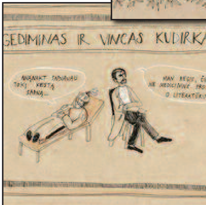
Knygos „Gatvių susitikimai“ fragmentai