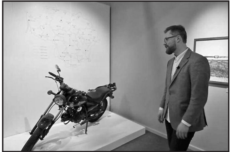
Šiuo mopedu autorius keliavo po Lietuvą.