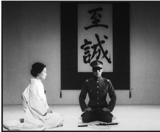
Paskutinis Mishimos ritualas

Galbūt toks autoriaus pasirinkimas gali būti nagrinėjamas per antrojo Y. Mishima kūrinio prizmę. Kūrinio, kuris Japonijos visuomenei atskleidė nuostabaus rašytojo talentą ir paliko jo kūrybos žymę Japonijos literatūros paveldui – „Kaukės prisipažinimai“ (angl. Confessions of a Mask ). Tai savotiška autobiografija su plonyčiais romano sluoksniais. Šios knygos istorija pasakoja apie subtilų, jautrų berniuką, kurį jo močiutė laiko nelaisvėje. Senatvės nelaisvėje. Močiutė serga, o berniukas yra įpareigojamas ją slau-