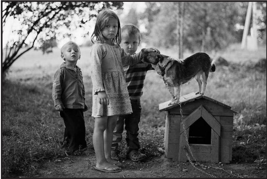
Ši fotografija atvėrė jos autoriui daug durų