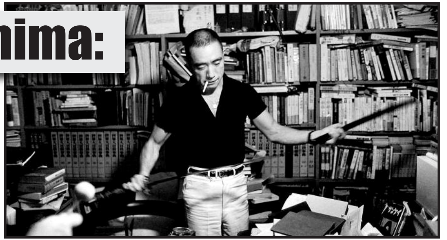
Yukio Mishima prie savo darbo stalo