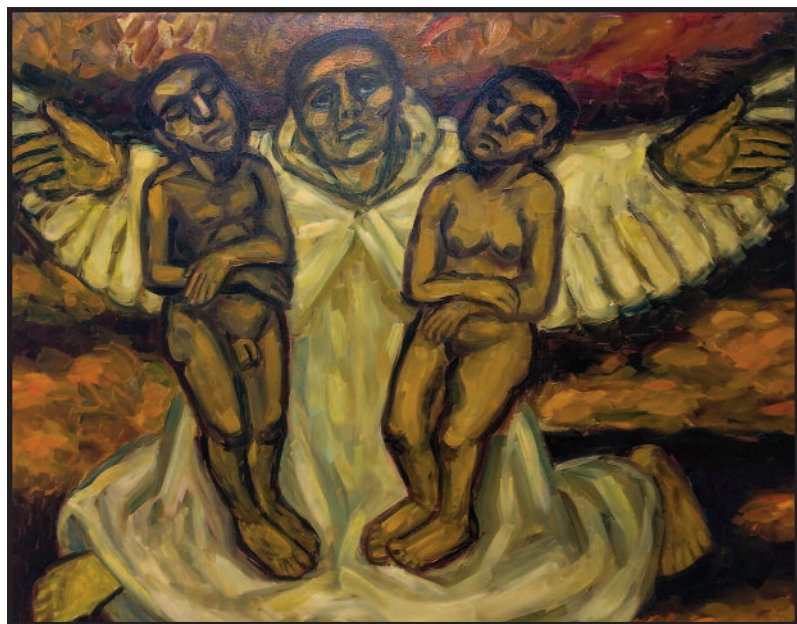
Eglė Velaniškytė. „Sklandžianti siela“

pavardės. Bet vis „prasilenkdavau“ su šia dailininke – turiu galvoje pirmiausia tapybos darbus, jų parodas, ne asmeninę pažintį.