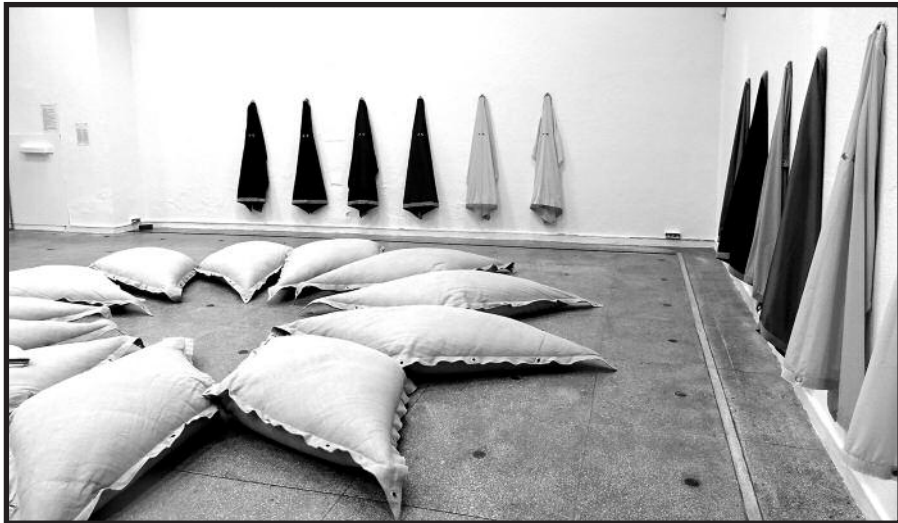
Originalūs įvairių šalių menininkų kūriniai pristatomi Paveikslų galerijoje.