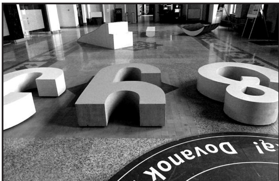
Parodos darbai pasitinka Kauno geležinkelio stotyje.

„Stebuklingų kilimų“ platformą sudaro Kauno bienalė, kuri yra projekto vadovas, taip pat atstovai iš Airijos, Jungtinės Karalystės, Portugalijos, Ukrainos, Vokietijos, Kroatijos, Italijos, Rumunijos, Latvijos, Serbijos, Čekijos, Austrijos, Sakartvelo, Prancūzijos meno institucijų. Šį projektą remia Lietuvos kultūros taryba, finansuoja Europos Sąjungos „Kūrybiškos Europos“ programa.