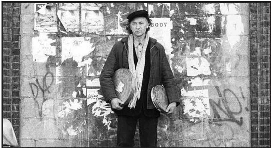
Paroda „Jonas Mekas ir Niujorko avangardas“