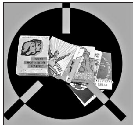
Paroda „Projektas – Homo sovieticus“

Religija parodoje taip pat tampa svarbiu elementu. Iš karto po Lietuvos