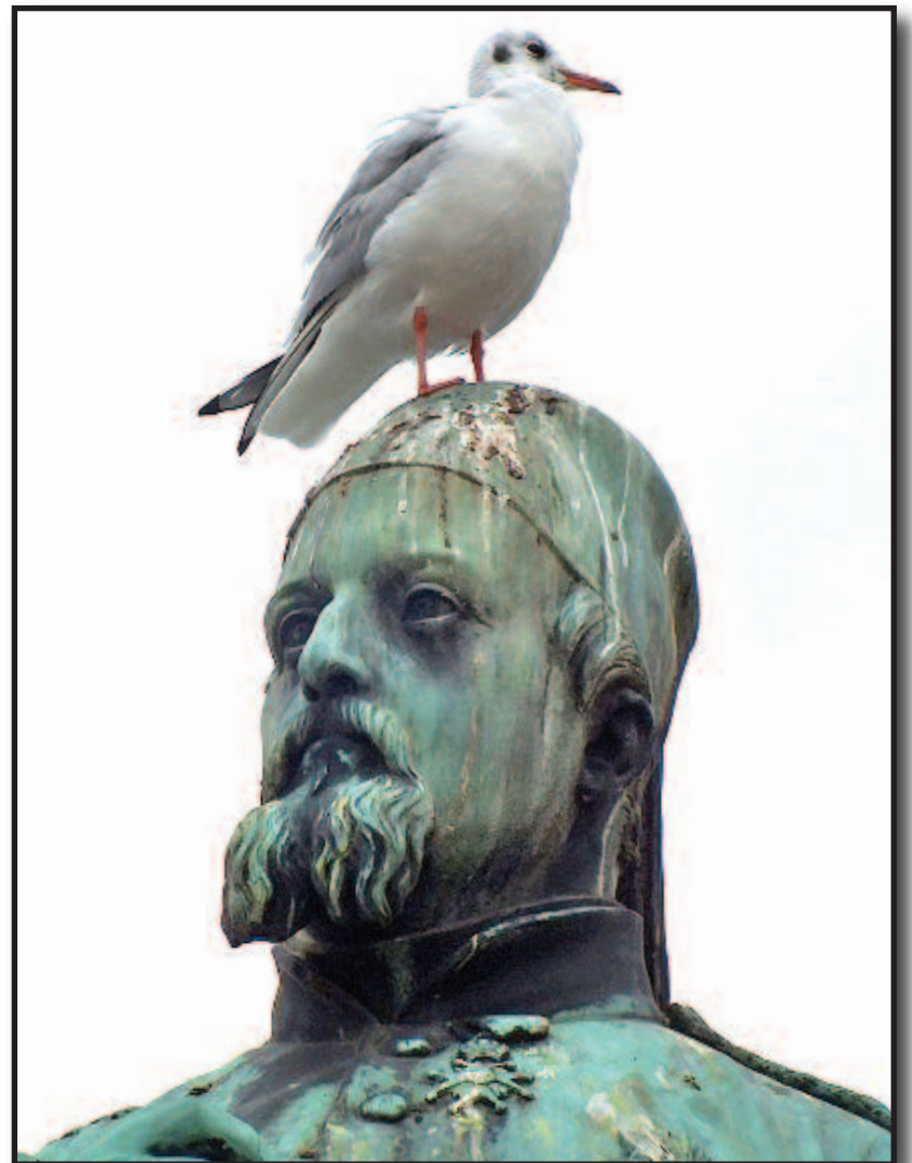
Sit transit gloria mundi.