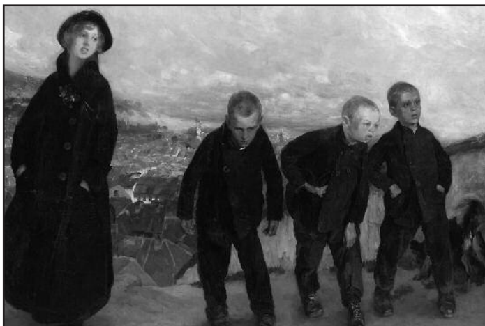
S. Bohušas-Sestšencevičius, „Priemiesčio vaikai“

Labiausiai dailininkas mėgo tapyti ir piešti kaimo bei mažų miestelių kasdienio gyvenimo vaizdus: turgaus ir mugių šurmuli su arkliais, spalvingais vietinių gyventojų tipažais, nesibai-