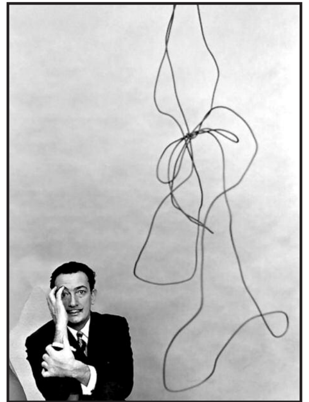
Salvador Dali portretas sukurtas 1951 metais