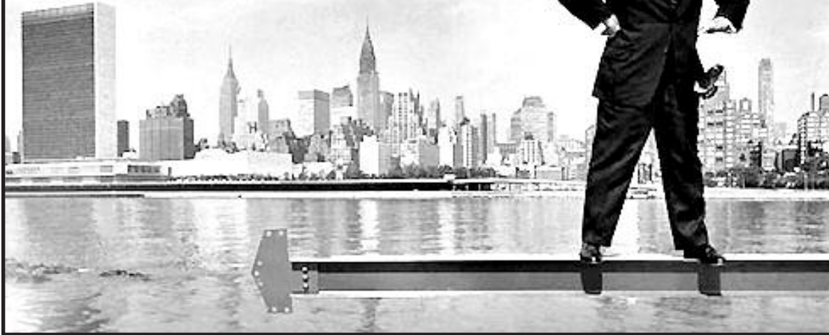
Parodoje Kaune – daugybė įžymybių portretų. New York miesto planuotojas Robert Moses.