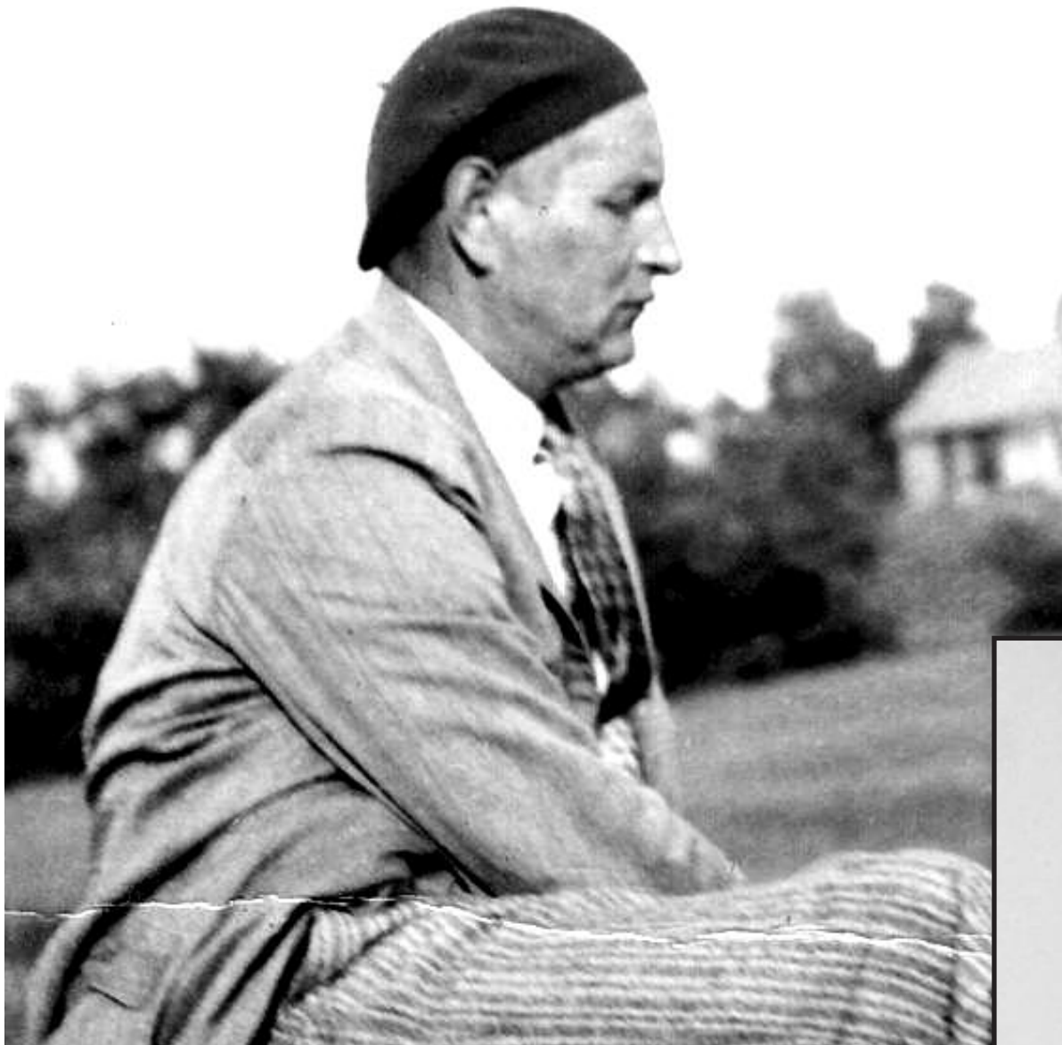
Balys Sruoga apie 1937-uosius.