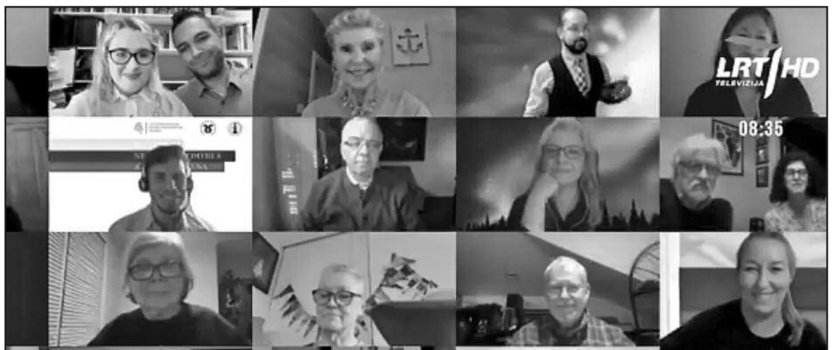
Renginio dalyviai ir svečiai jau beveik įprastoje bendravimo platformoje.