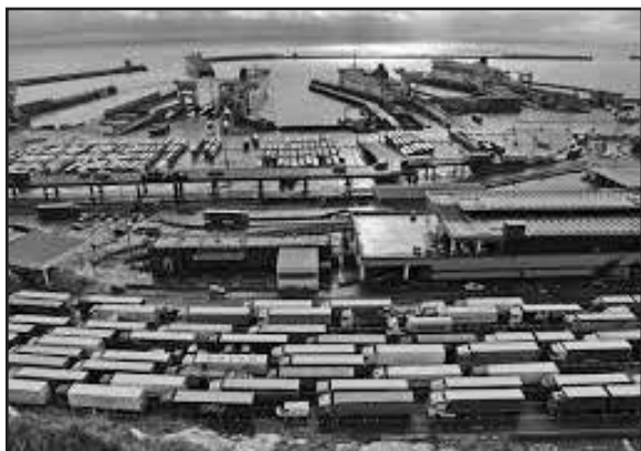
Žymiai ilgiau trunkantis krovinių deklaravimas ir pandemija, stabdo prekių judėjimą į ES.

2021 metų sausio mėnesį užfiksuotas prekių importo ir eksporto kritimas yra didžiausias mėnesio kritimas nuo tada, kai pradėti rinkti duomenys 1997 metų sausio mėnesį.