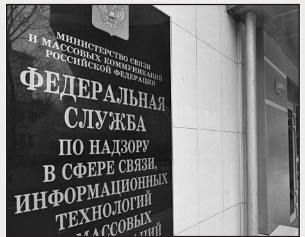
V. Putinui paklusni įstaiga „Roskomnadzor“ persistengė – norėjo užčiaupti protestus, bet užčiaupė Kremlių.

Kai kurios iš šių priemonių pakurstė bėgavimą dėl Kinijos stiliaus interneto žabojimų, bet paaiškėjo, kad jos yra veiksmingos tik iš dalies. 2018 metais, pavyzdžiui, Rusija mėgino uždrausti žinučių programėlės „Telegram“ paslaugas, bet taip ir nesugebėjo techniškai jos užblokuoti, o pernai šį draudimą apskritai atšaukė.