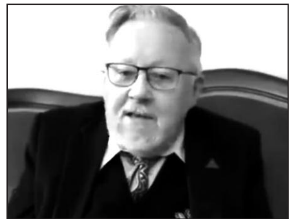
Prof. V. Landsbergis: „Lietuviai atmetė didžiąją melagystę“.