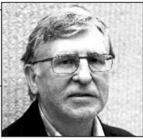
Parengė Vitalius Zaikauskas