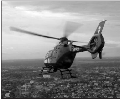
„Juodieji vanagai“ praskrido virš pakaunės.

AV sausumos pajėgų kariai Baltijos šalyse ir Rytų Europoje rotuojami nuo 2014 m. pavasario, kaip dalis JAV Sausumos pajėgų operacijos rytinėje Aljanso dalyje „Atlanto ryžtas“. Tuo JAV demonstruoja savo kolektyvinės gynybos įsipareigojimą NATO sąjungininkams užtikrinant saugumą po agresyvių Rusijos veiksmų Ukrainoje.