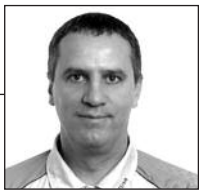
Parengė Dainius Ruževičius