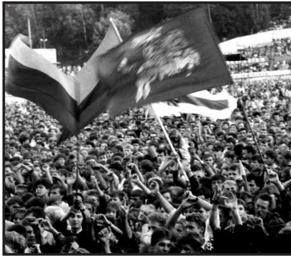
Roko maršo koncertas Kalnų parke. Vilnius, 1988.