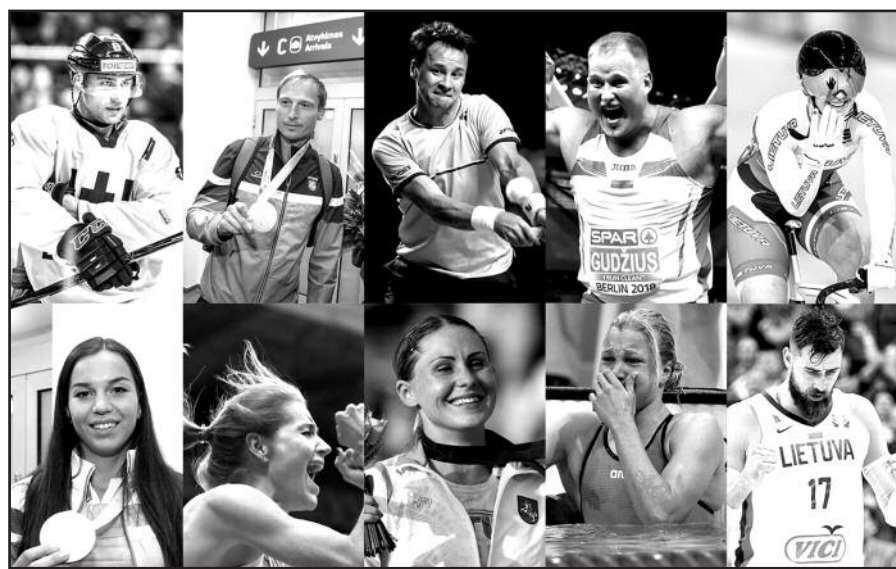
Sportininkus galime prilyginti savotiškais Lietuvos ambasadoriais, puoselėjančiais ir stiprinančiais valstybės identitetą.

Reprezentatyvią Lietuvos gyventojų apklausą atliko „Baltijos tyrimai“ 2021 m. vasario 9–12 dienomis. Tyrimo metu apklausta 530 Lietuvos gyventojų, kurių amžius svyruoja nuo 18 iki 74 metų.