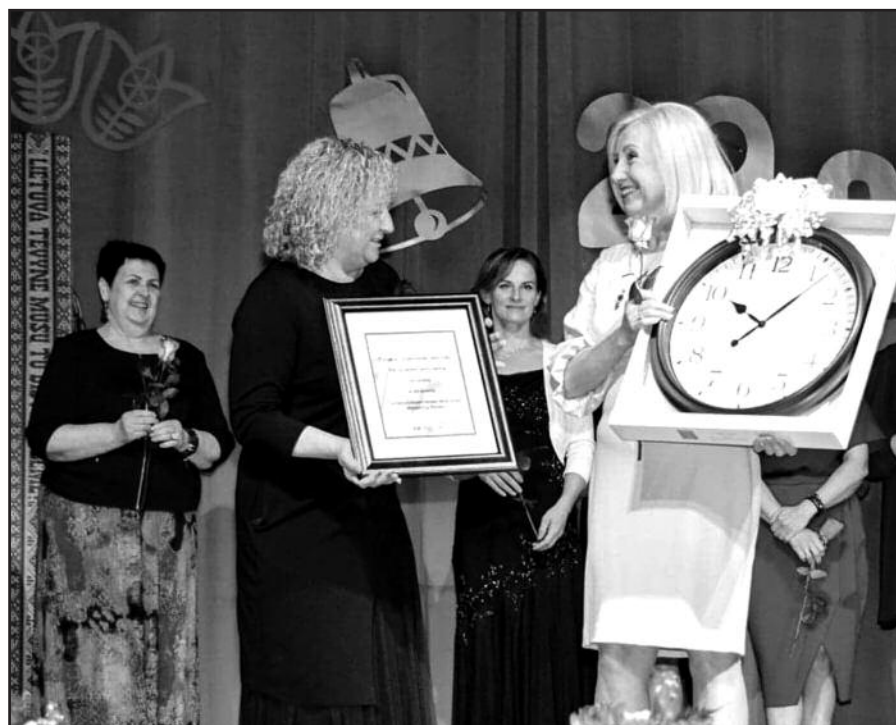
29-tosios laidos dovana mokyklai – ČLM stipendijos fondui pinigai ir laikrodis, kad niekas nevēluotų.