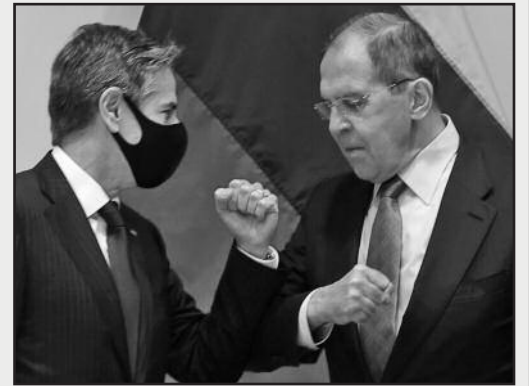
A. Blinken, S. Lavrovas susitiko aptarti būsimą JAV ir Rusijos prezidentų susitikimą.