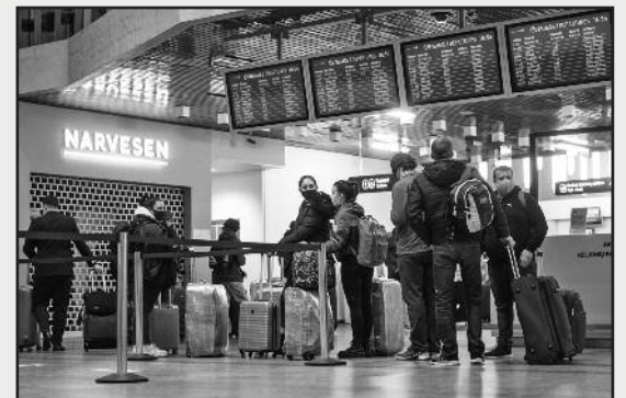
Atvykstantiems į Lietuvą ir išvykstantiems iš jos, patariama susipažinti su karantino reikalavimais atvykimo ir išvykimo dienomis.