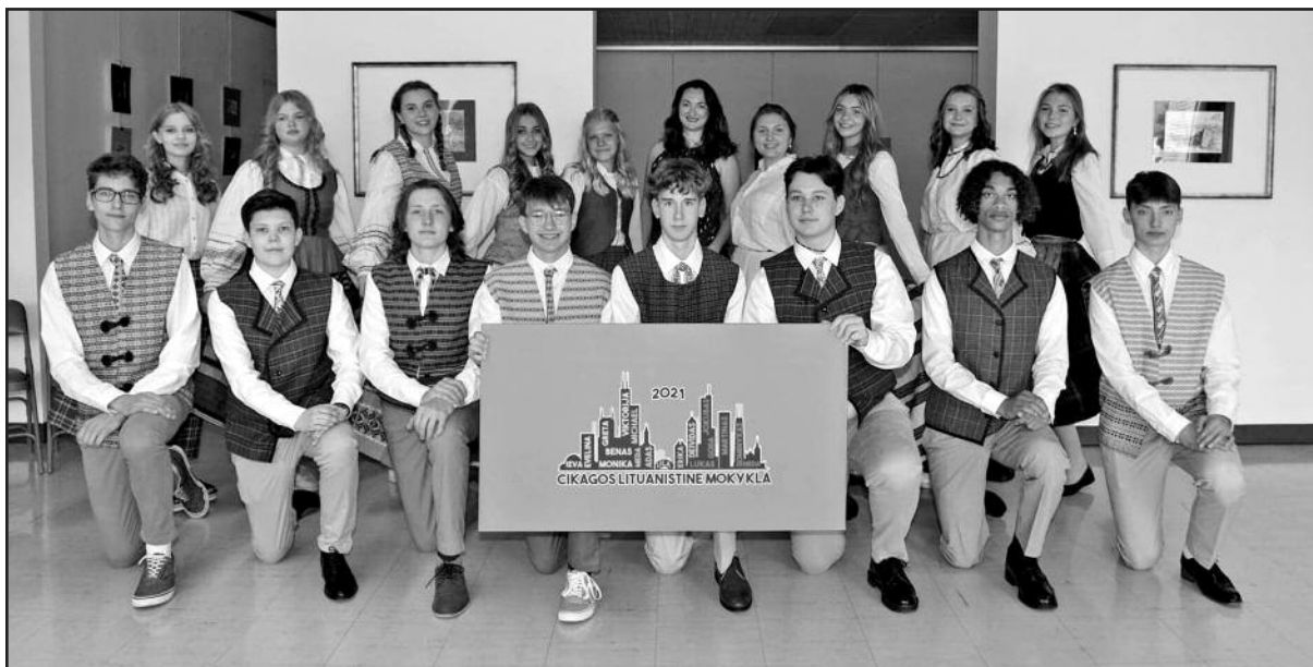
ČLM 29-tosios laidos abiturientai.