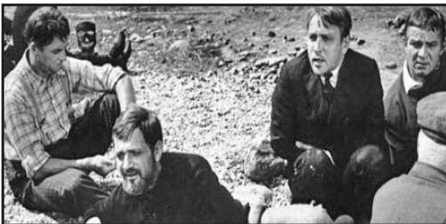
Almanto Grikevičiaus 1969 m. juosta Ave, Vita!