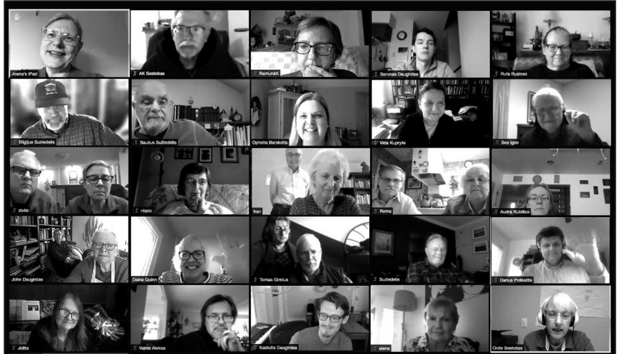
Čikagos ateitininkų surengtų diskusijų apie išeivijos pastangas padėti Lietuvai 1990–1991 m. dalyviai.

bę. Per penkių dienų trukmės kelionę jis susitikinėjo ir susipažino su Sąjūdžio vadais. Nors visi Sąjūdyje siekė Lietuvos nepriklausomybės atstatymo, išryškėjo dvi skirtingos frakcijos. Vytauto Landsbergio grupė siekė nepriklausomybės teisiniais pa-