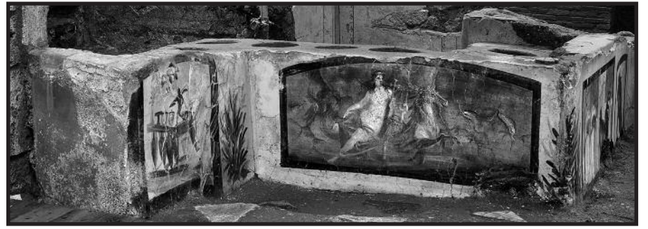
Taip ištapytas buvo prekystalis antikos laikų užkandinėje, kurioje Pompėjos gyventojai įsigydavo karšto maisto išsinešimui.

79-aisiais mūsų eros metais Italijos miestą Pompėją sunaikino didžiausias iki šiol iš visų rašytinėje istorijoje užfiksuotų Vezuvijaus ugnikalnio išsiveržimas. Šis greta dabartinio Neapolio įsikūręs miestas buvo pamirštas iki XVIII amžiaus, kai galiausiai buvo atrastas palaidotas po aštuonių metrų pelenų sluoksniu. Atrastas miestas atskleidė svarbių faktų apie senovės Romą ir jos gyventojus. Beje, tokią kelių metrų gylyje užkonservuota Pompėja netyčia buvo atrasta tik 1599 metais, bet ją atradęs architektas, kuris rausė kanalą, tyčia ar netyčia niekam apie tai nepasakojo, niekas ten daugiau ir nebekasinėjo. O nuo XVIII a. vidurio Pompėją pradėjo rausti skersai išilgai, ir dar teberaushia iki dabar.