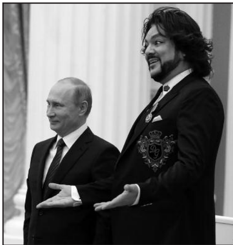
Rusų daininkas F. Kirkorovas, ne kartą koncertavęs okupuotame Kryme, teisiiasi su Lietuva dėl jo paskelbimo nepageidaujama asmeniu.

Įstatymas priimtas už balsavus 113, prieš buvus vienam, susilaikius 16 Seimo nariams.