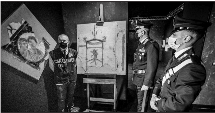
Italijos karabinieriai saugo atgautas freskas.

Šešios freskos, prieš daug metų pavogtos iš senovinių romėnų vilų griuvėsių, buvo sugrąžintos į Pompėjos archeologijos parką, antradienį, gegužės 19 dieną pranešė italų policija.