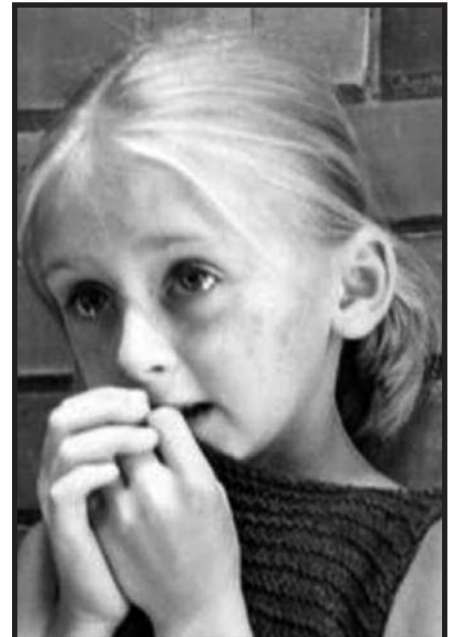
Arūno Žebriūno filmas Gražuolė

New York Baltic Film Festival organizatoriai praneša, kad nuo gegužės 26 d. iki birželio 1 d. internetu bus galima nemokamai pasižiūrėti devynis Baltijos šalių filmus, sukurtus tarp 1968 ir 1980 metų. Šiuos filmus buvo numatyta rodyti 2020 m. pavasarį kino salėje, tačiau pandemija tuos planus sugriovė. Po metų nutarta filmus rodyti internetu. Atrinktus po tris kiekvienos šalies filmus – tarybinio laikotarpio klasiką – jungia bendras festivalio pavadinimas Baltic Modernist Cinema: Between Imaginary and Real („Modernistinė Baltijos kinematografija: tarp įsivaizduojamo ir realybės“). Pasak festivalio rengėjų, šie filmai atspindi sovietmečiu dirbusių režisierių pastangas rasti naujų pasakojimo būdų ir išsivaduoti iš nusistovėjusių kinematografijos tradicijų. Tai savotiškas Baltijos šalių kūrėjų įnašas į tuo metu plintantį modernistinį kiną Europoje, žinomą kaip New Wave .