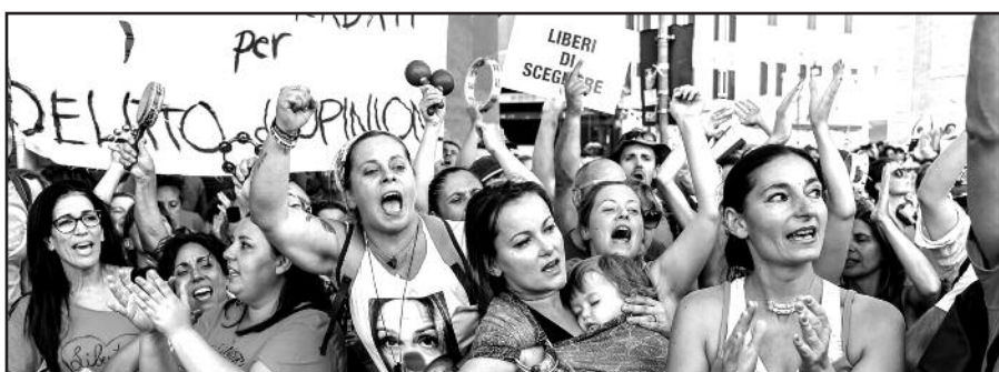
Italų antivakseriai kūrė planus smurtiniams veiksams.

Keleiviai, norėdami naudotis tolimojo susisiekimo geležinkelio paslaugomis, turi pateikti skiepavimo, pasveikimo įrodymą arba neigiamą testo rezultata.