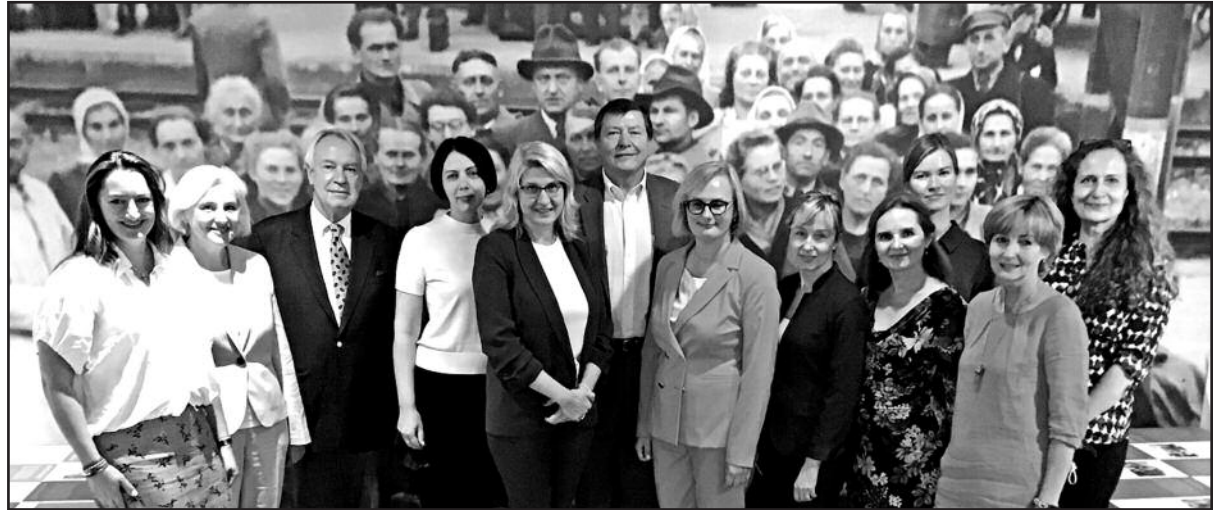
Muziejaus svečiai ir Direktorių tarybos nariai, darbuotojai nusifotografavo prie DP stovykloje įamžintų lietuvių nuotraukos – praeitis ir dabartis tarsi susiliejo.