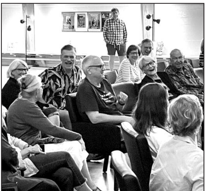
Smagios diskusijos Kennebunke.