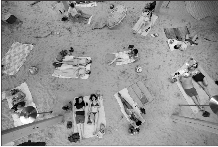
Operoje žmonės atrodo tarsi vabaliukai...