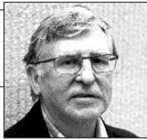
Parengė Vitalius Zaikauskas