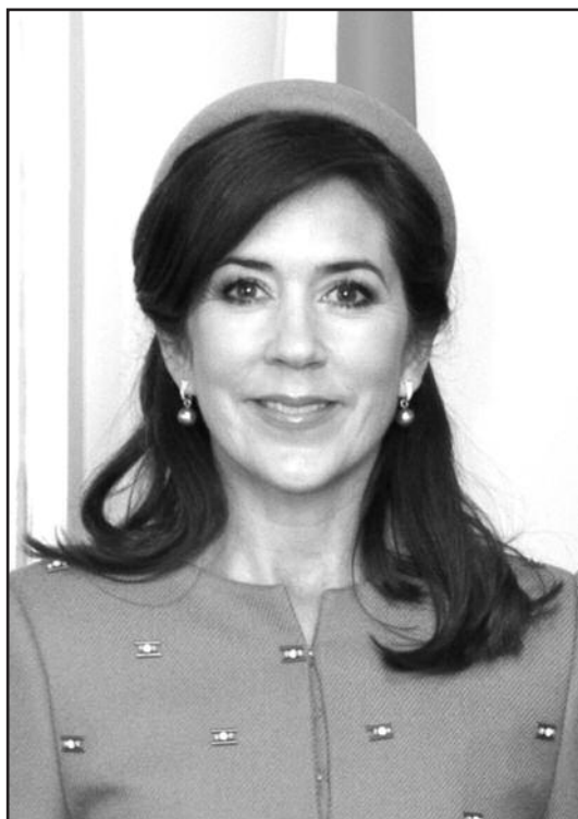
Baigiantis rugsėjui Lietuvoje viešės Danijos kronprincesė Mary.

Lietuvą su Danija sieja įvairiapusis bendradarbiavimas vizualiųjų menų, kino, teatro, šokio, muzikos, archyvų, muziejų, bibliotekų srityse.