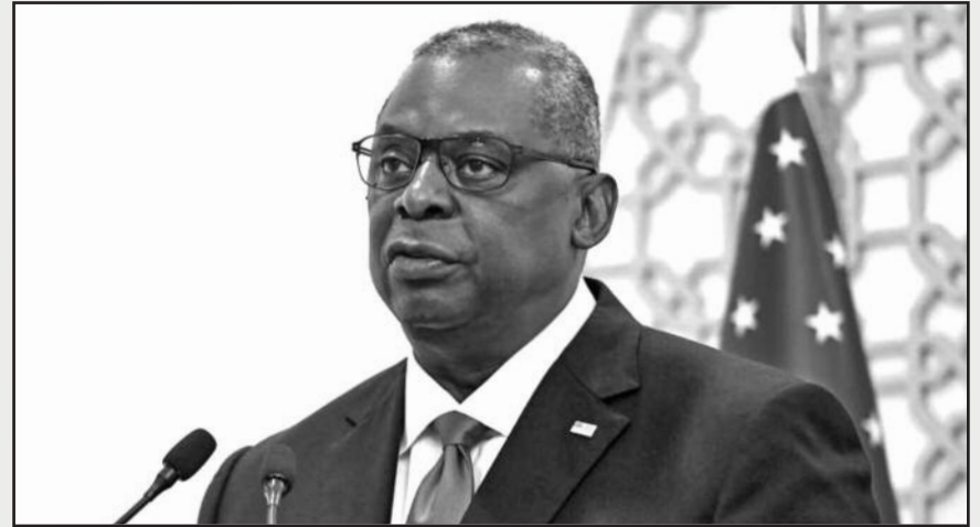
Lloyd Austin teigia, jog tikėtinas „al Qaeda“ atgimimas.

JAV gynybos sekretorius Lloyd Austin ketvirtadienį rugsėjo 9 dieną pareiškė, kad ekstremistų tinklas „al Qaeda“, prieš 20 metų pasinaudojęs Afganistanu kaip placdarmu atakoms prieš Ameriką surengti, gali vėl pamėginti įsitvirtinti šioje Vidurio Azijos šalyje, kur pasitraukus NATO pajėgoms, į valdžią sugrįžo Talibanas.