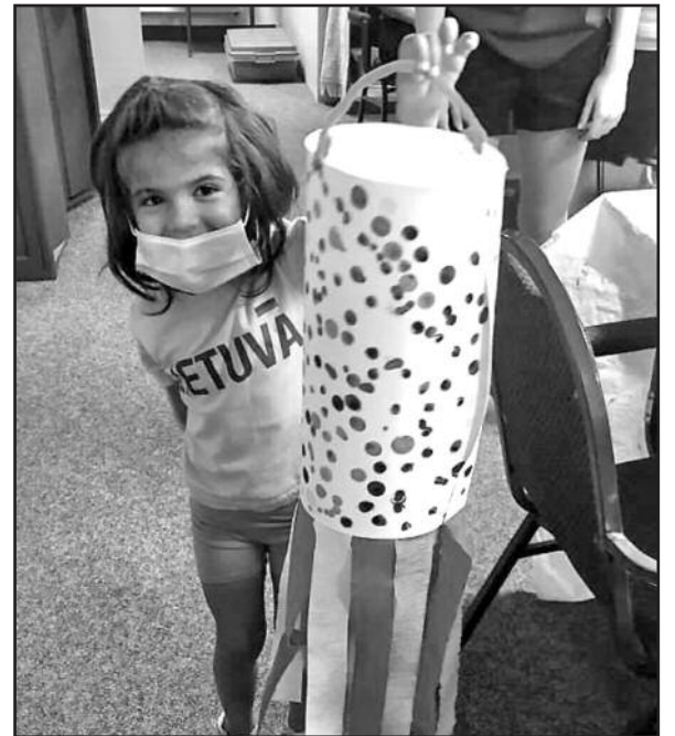
Meilė Lietuvai diegiama nuo mažų dienų.