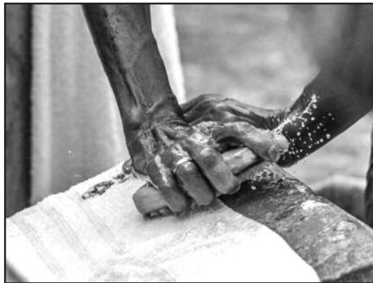
Nusikaltėlis už bausmę visą pusmetį kankinsis skalbdamas moterų drabužius.