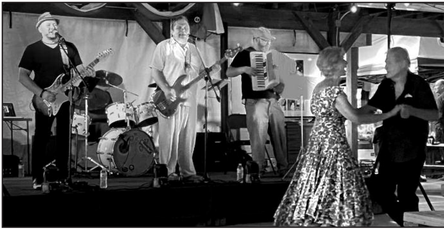
Išgirdę smagias muzikantų melodijas, į aikštelę ėmė rinktis šokėjai.