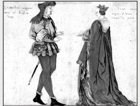
UNESCO programos apsauga skirta vienam ankstyviausių Vytauto Didžiojo ir jo žmonos Onos atvaizdų.

Į Lietuvos nacionalinį registrą „Pasaulio atmintis“ įtrauktas Vytauto Didžiojo ir Onos Vytautienės imaginacinis (išvaizduojamas) atvaizdas yra unikalus paveldo objektas dėl ypatingai retų išlikusių šių ankstyvųjų Lietuvos valdovų portretinių atvaizdų.