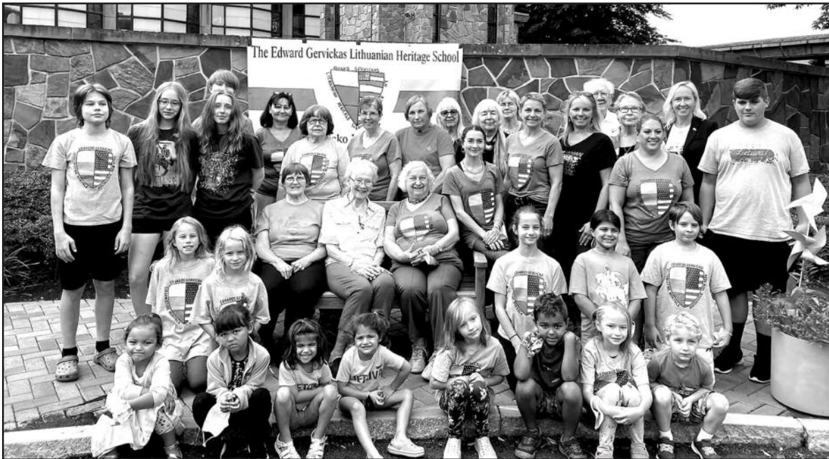
E. Gervicko mokyklos bendruomenė susirinko į mokslo metų pradžios šventę.