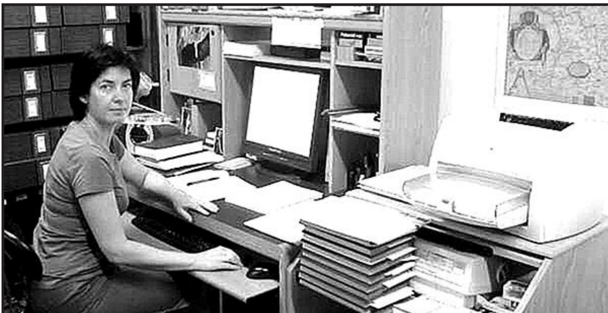
Apsilankymas Putname, ALKA.