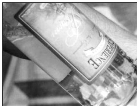
Lietuvoje mažėja alkoholio vartojimas, tačiau didėja vis dar nėra ko, nes auga svaiginamasis narkotikais.

„Ką reiškia mažėjantis alkoholio vartojimas mums Lietuvoje, tai pirmiausia mažėjanti našta mokesčių mokėtojams, apkrova ligoninėms ir gydymo įstaigoms“, – sakė R. Čiužas.