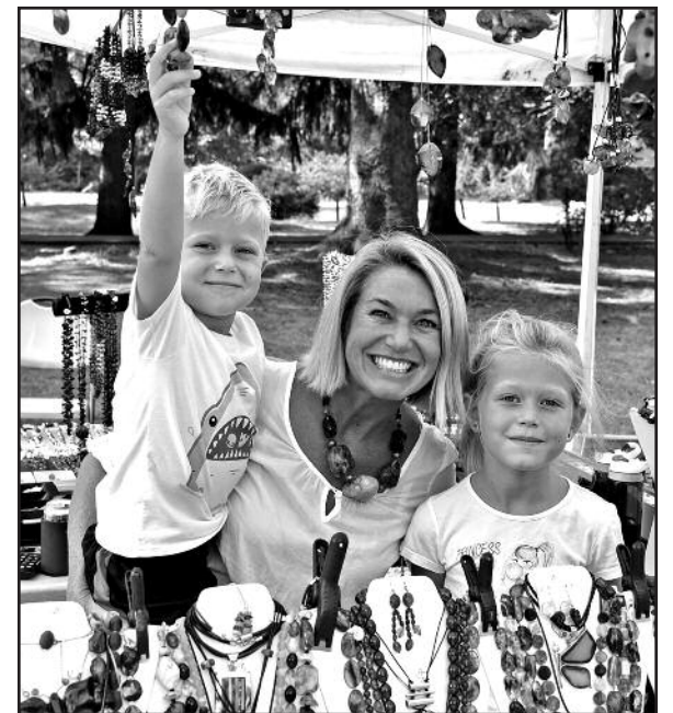
Geros nuotaikos netrūko ir šiems pardavėjams, prekiaujantiems „Lietuvos auksu“.