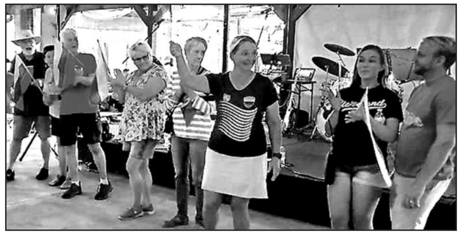
Viena iš daugelio smagių šventės akimirų, paskatinusi šypsotis ir džiaugtis.