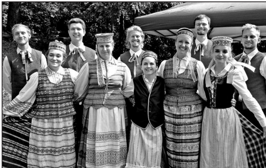
Meninę programą atliko ir linksmą šventinę nuotaiką sukurti padėjo „Spindulio“ šokėjai.