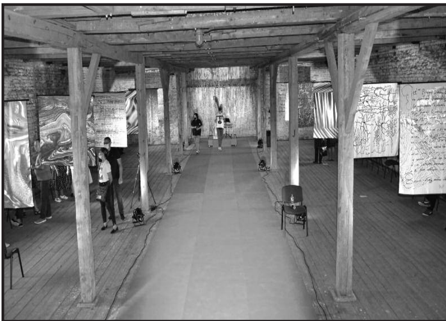
Virbalyje vykusį renginį menininkas pavadino pačiu įsimintiniausiu.

Baigdamas savo išpūdingą viešnagę Lietuvoje menininkas sakė, kad visi planuoti renginiai jam pavyko, pasivaikščiavimas protėvių takais buvo ištis išpūdingas. Jis išsitikinęs, kad jei neatsitiks kažkas netikėto, dar ne kartą grįš į savo tėvų žemę, domėsis, kaip sekasi „Atminties raštų“ kūrimo darbai, o čia jo lauks didelis būrys bičiulių, jo kūrybos gerbėjų ir vertintojų.