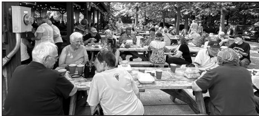
Susirinkusiems buvo gera pasidžiaugti gyvu bendravimu, pasivaišinti gardžiais lietuviškais patiekalais.

Šių metų rugpjūčio 21 dieną, šeštadienį, Clevelando Lietuvių klubo nariai gausiai susirinkome jaukioje sodyboje į metinį pikniką. Saulėtą popietę visiems šio susibūrimo dalyviams buvo gera vėl pasidžiaugti gyvu bendravimu, kurį buvo sustabdžiusi COVID-19 pandemija.