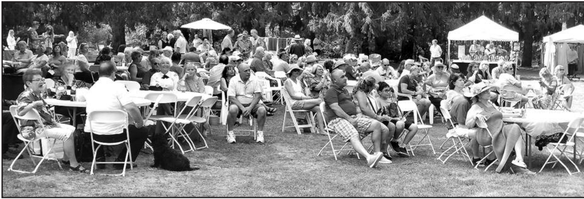
Įvairių kartų lietuviai net iš keturių valstijų suvažiavo paminėti „Lietuvos sodelio“ jubiliejus.