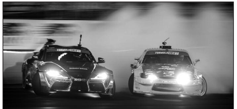
Lenktynių trasoje – Aasbo prieš „Odi“.