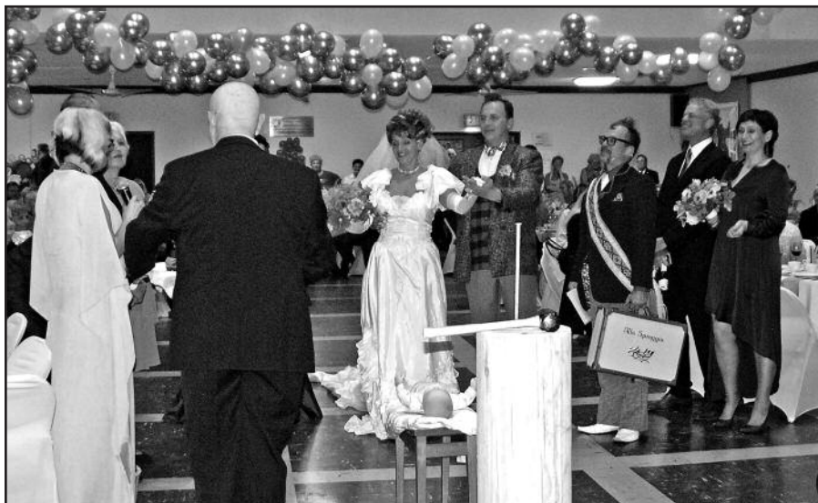
Išėivijoje gyvenantys lietuviai susirinko į vieną linksmiausių metų renginių – inscenuotą pokylį „Smagios lietuviškos vestuvės“.