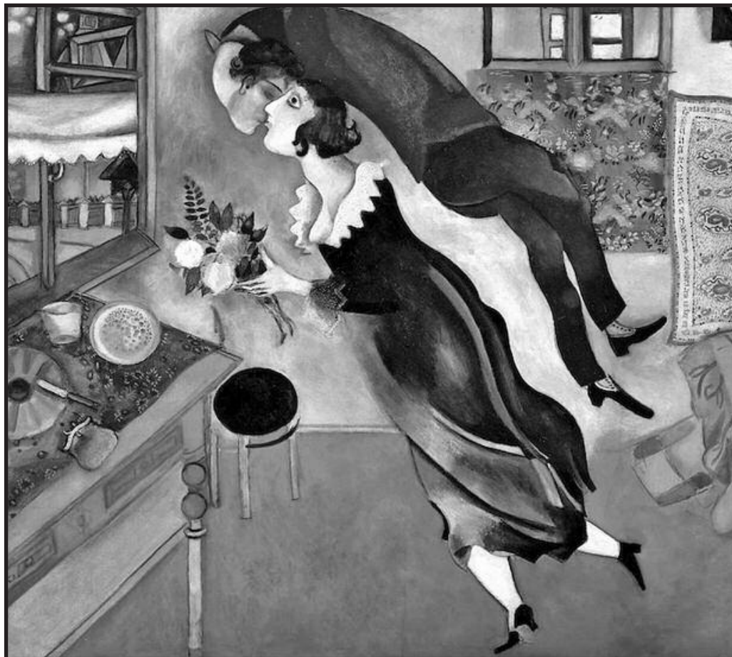
Marc Chagall, „Gimtadienio bučiny“ (1915 m.). New Yorko šiuolaikinio meno muziejus.

Įsimylėti nereiškia mylėti. Įsimylėti galima ir nekenčiant. („Broliai Karamazovai“)