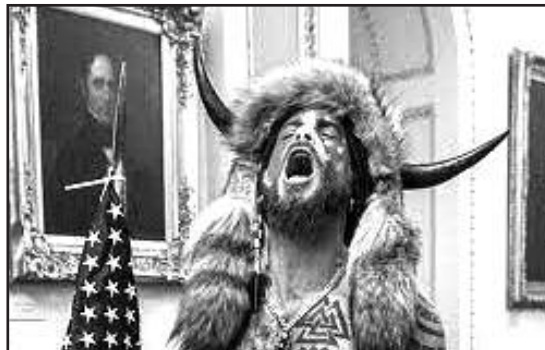
J. Chansley prokurorai siūlo nuteisti ketveriems metams.

Per išpuolį arba netrukus po jo žuvo penki žmonės, įskaitant policijos pareigūną ir protestuotoją, kurią nužudė pastate buvęs pareigūnas.