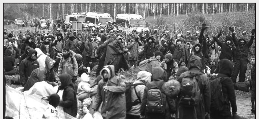
Apie 4 tūkstančiai neteisėtą migrantų lūkuriuoja Baltarusijos-Lenkijos pasienyje, tačiau nerimaujama, kad ji bet kada gali pajudėti Lietuvos-Lenkijos sienos link.