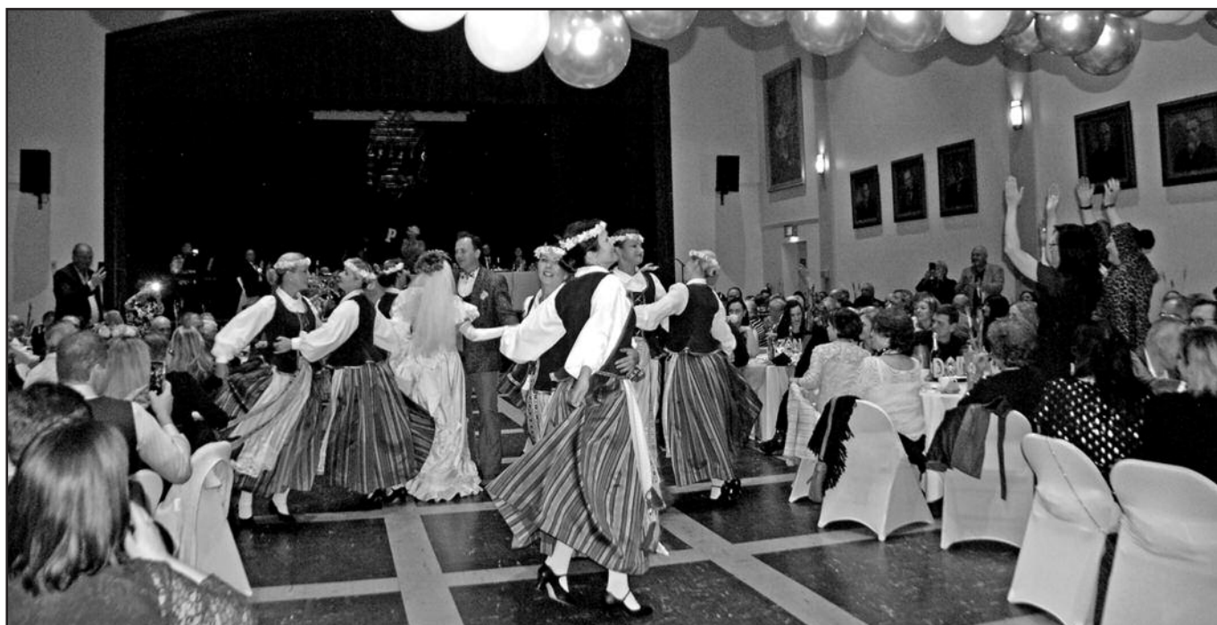
Ansamblio „Rusnė“ šokėjai nepaliko abejingų.