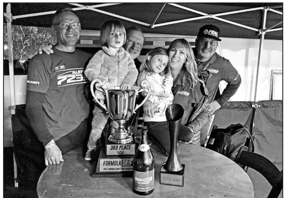
Rimčiausi „Odi“ sirgaliai su trofėjais.