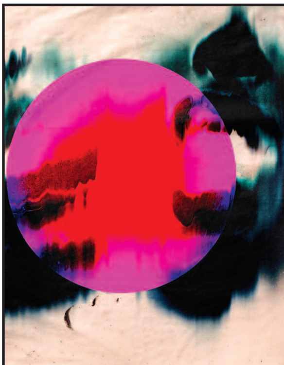
Nauja būtis, 2024