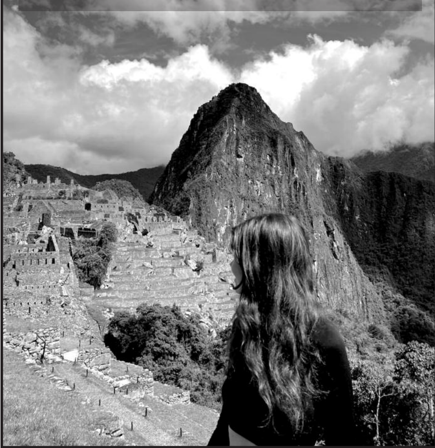
Maču Pikču viršūnė