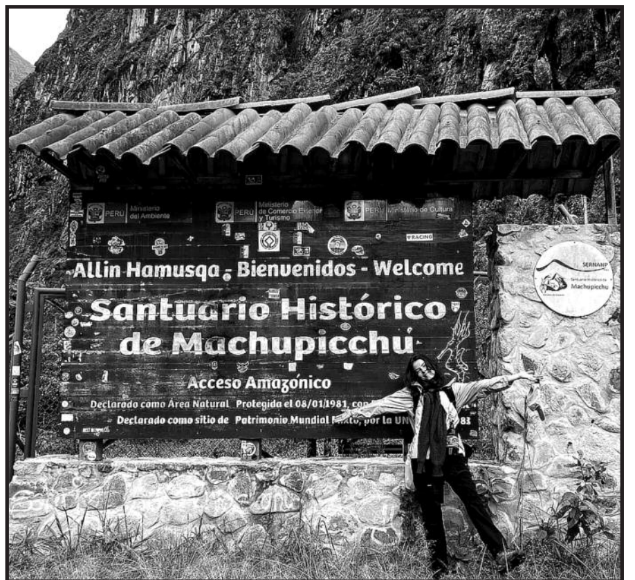
Pakeliui į Maču Pikču.

Tačiau man nuostabiausias ir vertingiausias Salkantay kelio aspektas buvo pakely sutikti žmonės. Ne tik tie, su kuriais susipažįsti keliaujant iki Maču Pikču, tačiau ir vietiniai, kurie priima nakvynei, pamaitina, papasakoja apie vietines tradicijas, pavaišina kava ir medumi, paveža iki reikiamos stotelės tolesnei kelionei. Visi žmonės, sutikti kelyje, buvo nepaprastai draugiški, geri ir linkintys sėkmės visiems, trokštantiems savo jėgomis pasiekti Maču viršūnę. Labai rekomenduoju, jeigu tik turite sveikatos ir galimybių – keliaukite, sutikite, pažinkite, susipažinkite, nes tai yra neįkainojama patirtis ir nuostabus gyvenimo įprasminimas. Ačiū, Pachamama!