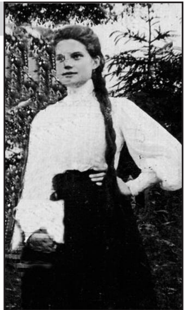
Marija Pečkauskaitė-Šatrijos Ragana, 1896 m.