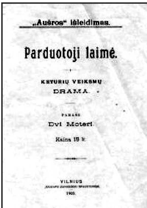
Parduotoji laimė. Parašė Dvi Moteri (Žemaitė ir G. Petkevičaitė-Bitė), 1905 m.

Susitarėm dabar, paduodamos ranką viena antrai, keliauti taku mylimosios literatūros. Ko aš nežinosiu ar nesuprasiu, jos pasiklausti arba knygos kokios nuo jos gauti. O ji ką parašius, aš prižadėjau kalbą pataisyti. Turinti pradėtą apysaką ilgą. Dar nebaigtą. Daugiau iš inteligentų gyvenimo. Kai pabaigs, duos man kalbą taisyti. Pamatysma, kaip mums pavyks. Tep išviešėjau celanėdėlę (lygiai panėdėly išvažiavom). Antrad. Poni, senis daktaras važiavo į Panevėžį ir mane nuvežė.