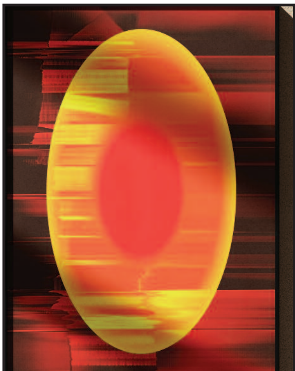
Grybo šviestuvai, 2024