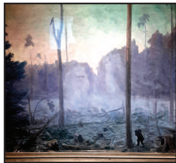
Eskizą „Miškas užia, verkia, gaudžia“ šiomet muziejui padovanojo mecenatai

Namą Kaune, V. Putvinskio gatvėje, kuriame gyvena dailininko šeima, suprojektavo architektas Vytautas Landsbergis-Žemkalnis. Jame Žmuidzinavičiai apsigyveno praėjusio amžiaus ketvirtojo dešimtmečio pradžioje. Muziejuje daug erdvės, šviesos, į akis krenta žalia grindų spalva, nes dailininkui tokia aplinka padėjo kurti. Dabar čia įrengta memorialinė buto ekspozicija, antrame