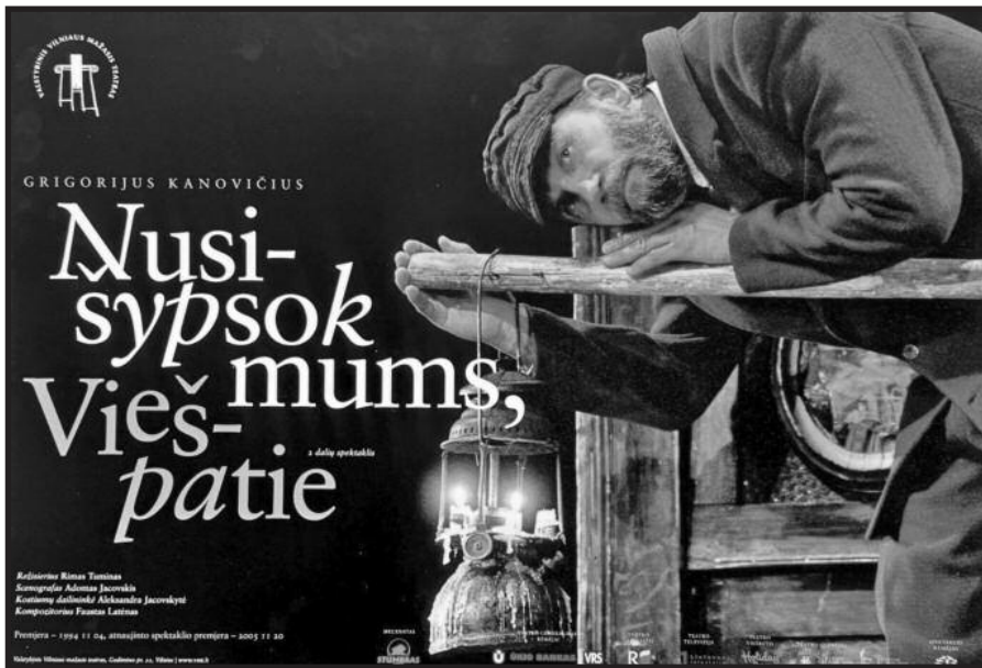
Legendinio spektaklio afiša