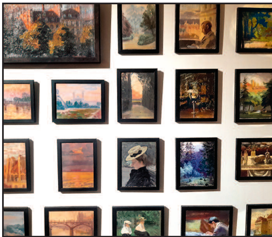
Parodoje eksponuojami A. Žmuidzinavičiaus skirtingo laikotarpio kūriniai.