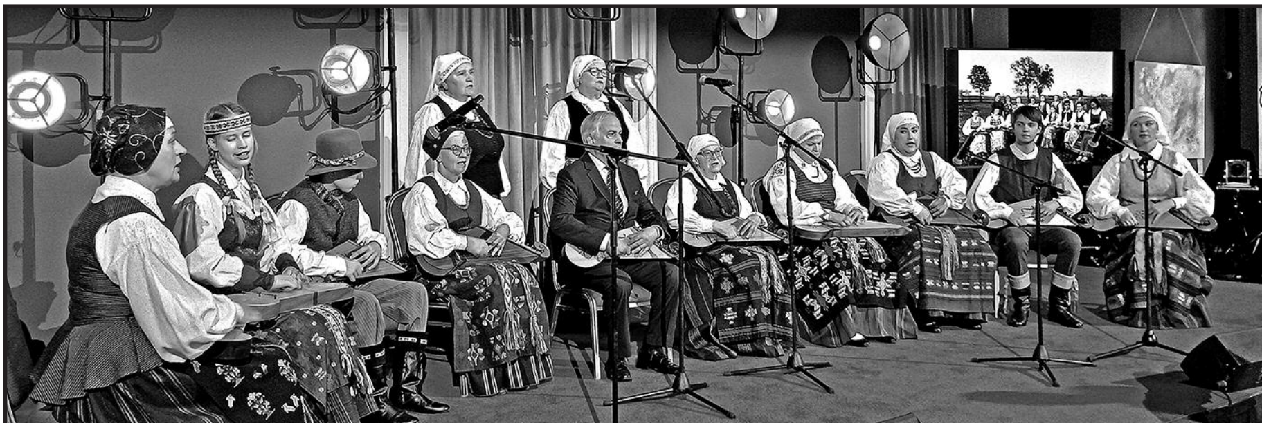
Pristatoma Lietuvos moldavų ir rumunų pavasario pasitikimo šventė Skriaudžių kanklininkai.

Įdomu buvo patirti analoginės fotografijos atgimimą, entuziastų pasiryžimą kurti nuotraukas tuo senoviniu, daug triūso bei įrangos reikalau-