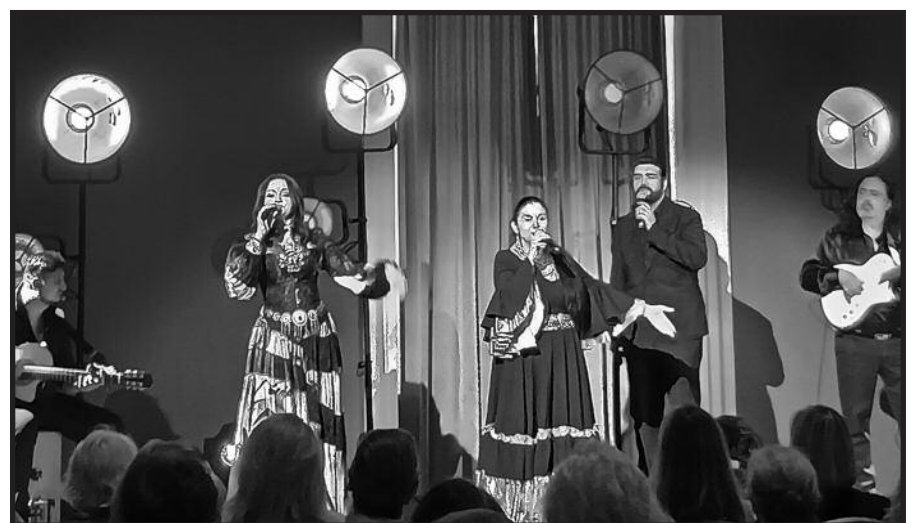
Romų kultūros festivalio Gypsy Fest pristatymas