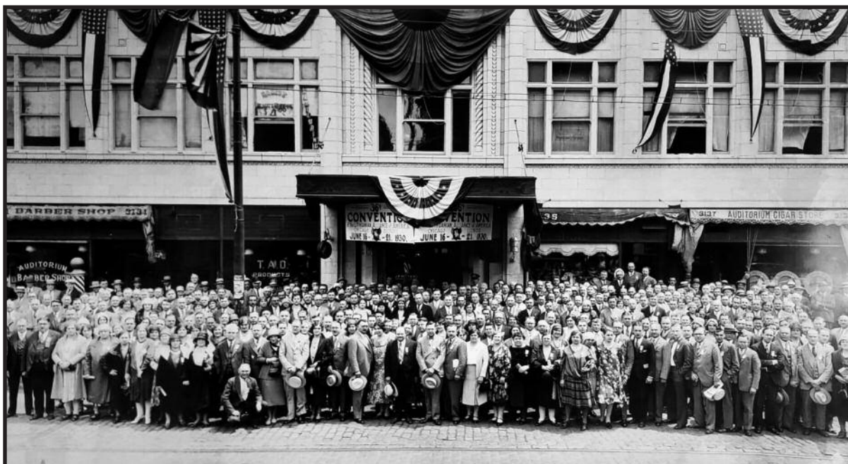
Susivienijimo lietuvių Amerikoje seimo dalyviai prie Lietuvių auditorijos 1930 m. (S.L.A.)