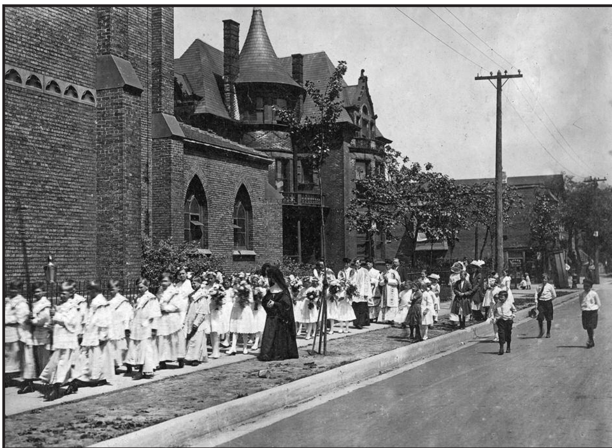
Šv. Jurgio mokinių procesija prie bažnyčios, Auburn gatve. 1913 m.