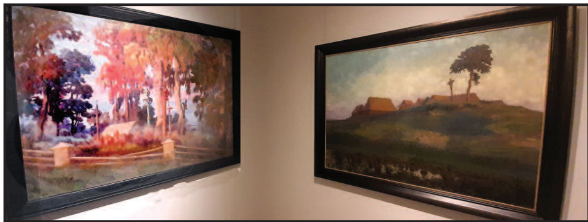
„Dzūkų bajorų kaimelis II“ (dešinėje) yra brangiausias iki šiol Lietuvoje parduotas Lietuvos menininko kūrinys.

Nuo 1908 m. dailininkas beveik nuolat klajojo po