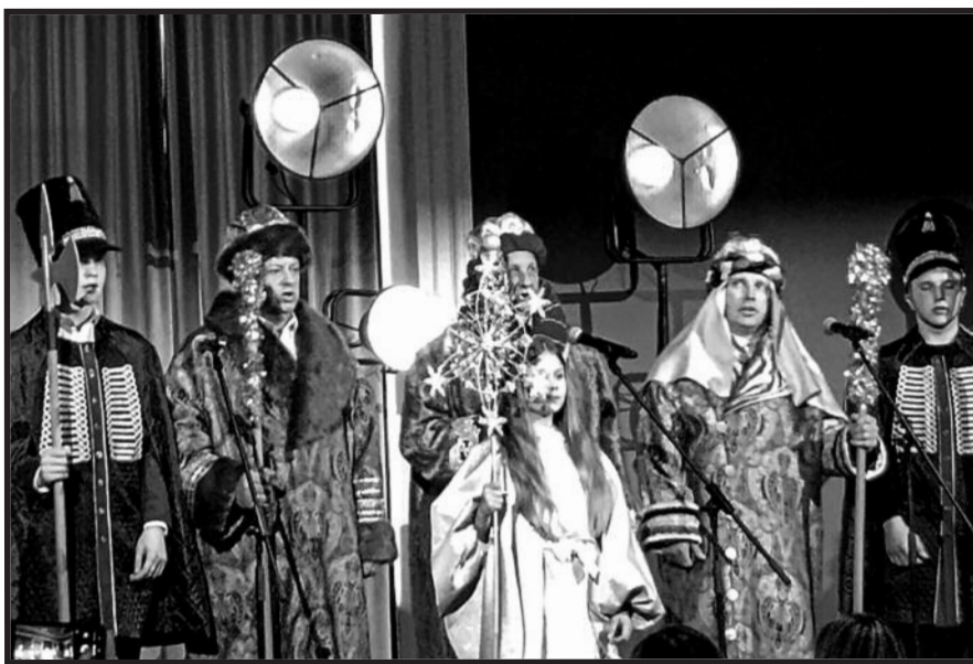
Darsūniškio kaimo persirengėliai – Trys Karaliai su palyda

Regėjome ir egzotiškus personažus – kai scenoje pasirodė Trijų Karalių vaikštynių dalyviai. Galinagai giedodami žengė scenon Darsūniškio kaimo (Kaišiadorių raj.) persirengėliai – puošniai pasidabinę Trys Karaliai su palyda, taip pristatydami tradiciją, užgimusią XX a. pradžioje, gal ir po pertrūkio puoselėjamą dabartyje, įgavusią, greta religinės, ir bendruomenės šventės prasmę.